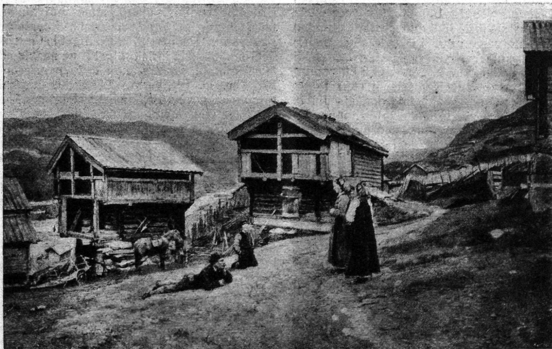
Gerhard Munthe: Norvega pejzaĝo

Ilia agado estas ligita al la modernaj artaj klopodoj, kiuj ekiris en Parizo kaj kiuj en la historie glora jaro 1878 — dato de la tiea bildekspozicio — venis triumfe en la arthistorion. Ĉi tiu arta klopodo alportis la finon de la bituma atelierarto. „ Plenaerismo “ . . . ĉi tiu devizo efikis la junajn pentristanimojn kiel nova mirindaĵo kaj kun brilantaj okuloj ili direktis siajn rigardojn al Parizo . Kaj en Parizo tagiĝis . . . Mirakloplena