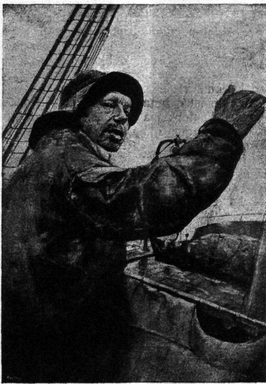
Christian Krohg: La ŝipgvidisto.

En profunda kortuŝeco, faletante kvazaŭ malŝanulo, la pastro repaŝis al la pastrodomo. Kiam li alvenis en la ĝardenon, al li krietante kuris renkonte du knabetoj, li kisis iliajn harojn, sed lia mieno restis fremda al tiu ĉi afero, kaj la rigardo de la okuloj vagis ie en nekonata malproksimo.