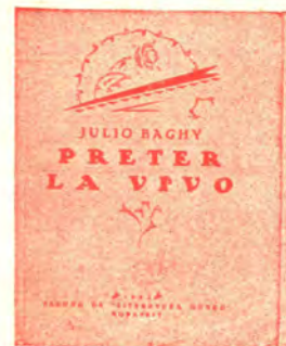
Poemaro, dua eldono 96 pĝ. bind. P 3.30 broŝ. P 2.20