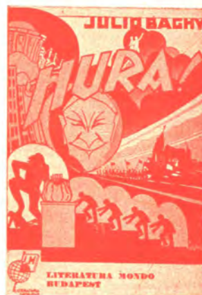
Romano 416 pĝ. bind. P 11.20 kaj P 9.30 broŝ. P 8.20