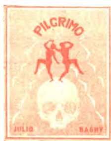
Poemaro 128 pĝ. bind. P 3.30 broŝ. P 2.—