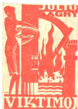
Romano, dua eldono 240 pĝ. bind. P 8.20 kaj P 6.50 broŝ. P 5.50