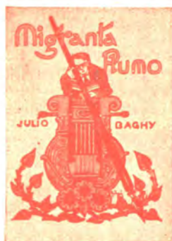
Novelaro 160 pĝ. bind. P 5.— broŝ. P 3.—

Pri prezoj kaj ampleksoj atentu niajn anoncojn!