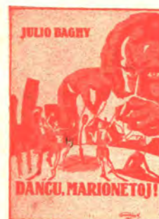
Novelaro, dua eldono 176 pĝ. bind. P 6.— kaj P 4.50 broŝ. P 3.80