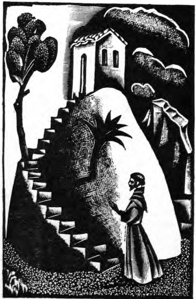
Pál C. Molnár: Lignogravuraĵo