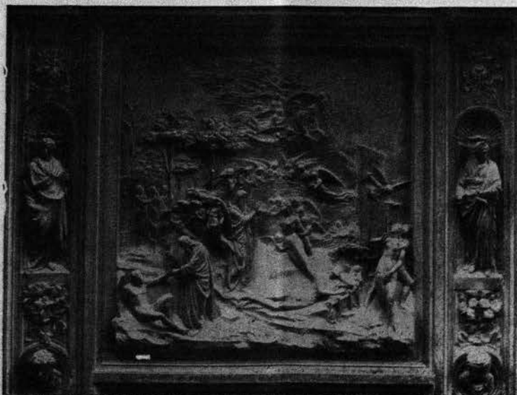
La kreo de la homo