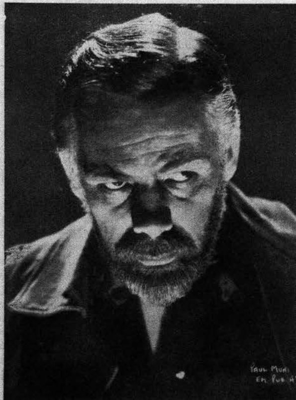
La Pasteur-masko de Paul Muni

Kelkfoje la parolado de Hektoro estis tre fanfarona. Li tro ofte menciis la famon kaj la riĉaĵon, kiujn li stre-