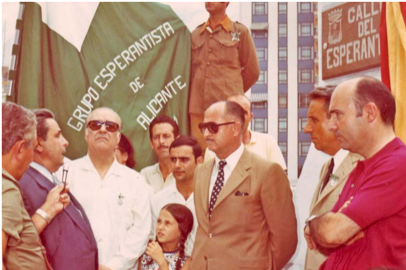
Ĉe oficiala inaŭguro de strato Esperanto de Benidormo, je 1973.