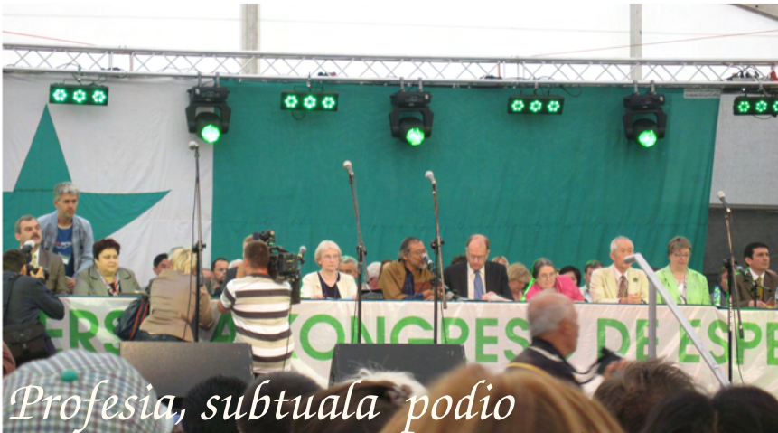
Profesia, subtuala podio

min, ke la antaŭan jaron mortis la lasta judo de Bjalistoko, urbo kies pli ol 60% de la loĝantaro estis juda; sed bedaŭrinde plej granda parto da ili estis ekstermita en gazejo de Osvicem, tiel, ke malgranda kvanto da ili supervivis la militon, sed ne ĉiuj el ili revenis en Bjalistokon. Do, la nuna loĝantaro de la urbo havas ne