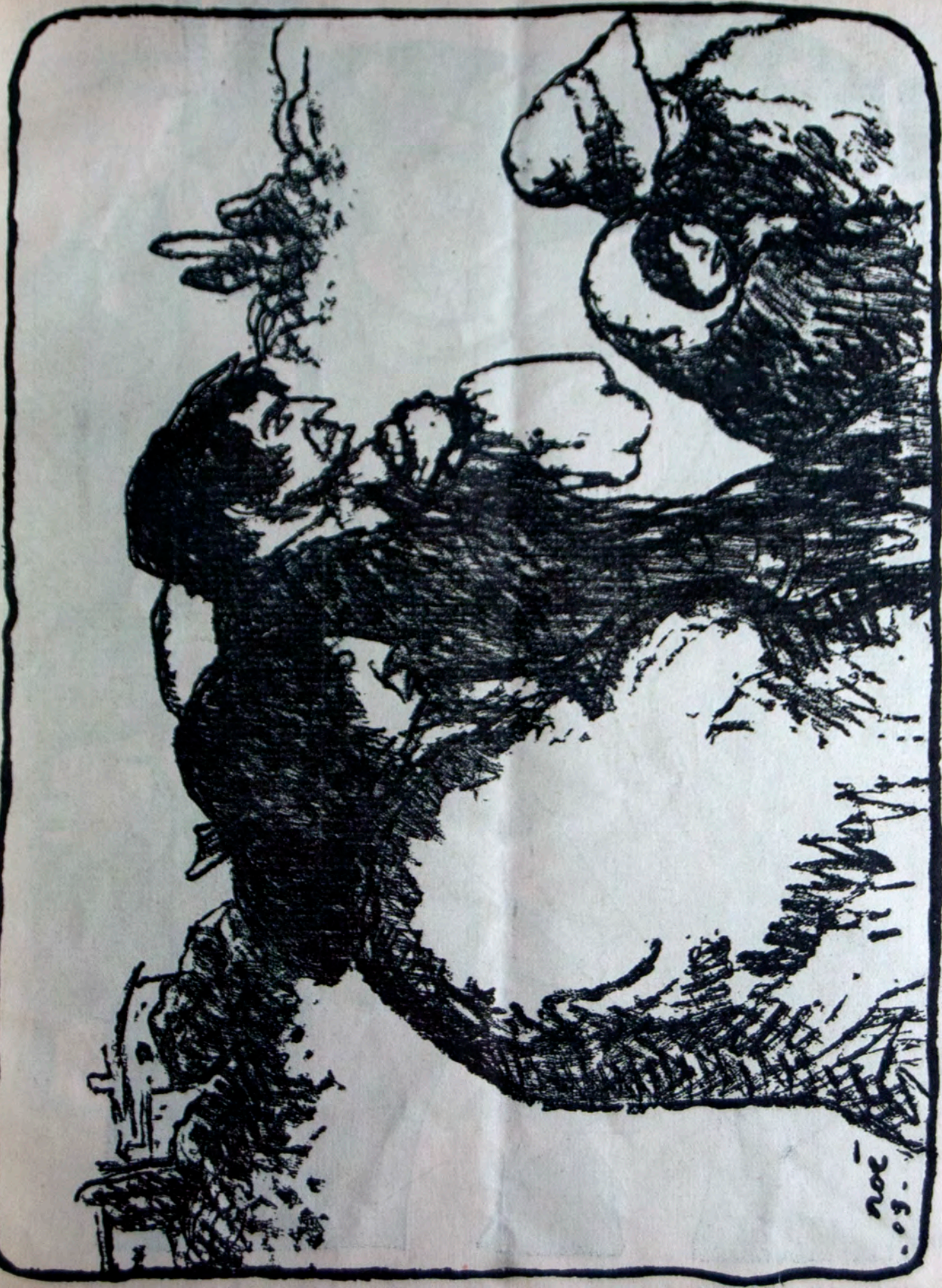
—Ni denove marŝadu...! En tiu vilaĝo oni povas nek rabi nek gajni al si la vivon!