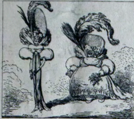
Karikaturoj pri la modo de plumoj.

James Gilray, angla karikaturisto de la XVIII a jarcento.