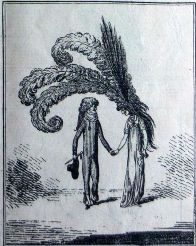
Karikaturoj pri la modo de plumoj.