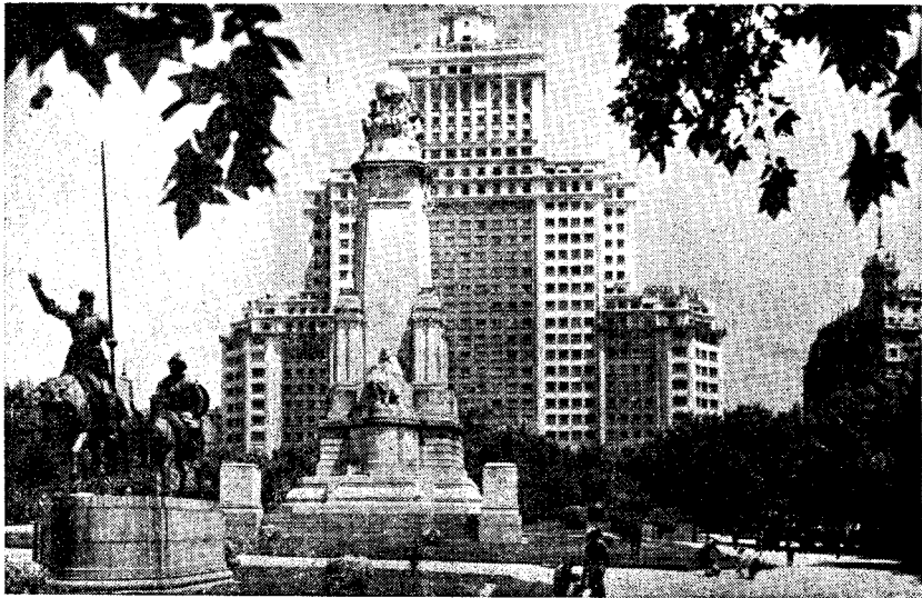
La moderna Domo Hispanio, en la samnoma placo, kaj Monumento al Cervantes