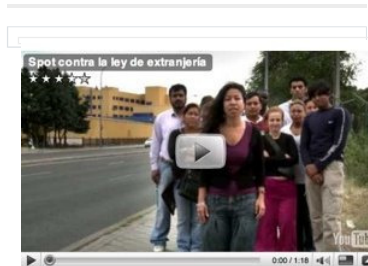
Spot contra la Ley de extranjería