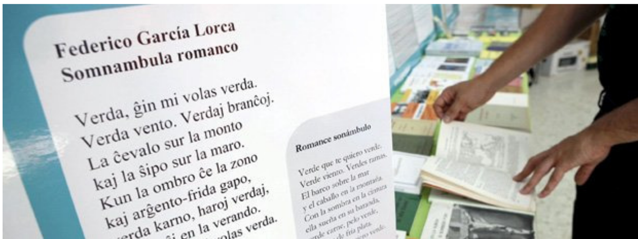
Poema de García Lorca en idioma esperanto

Sé el primero de tus amigos a quien le gusta esto.