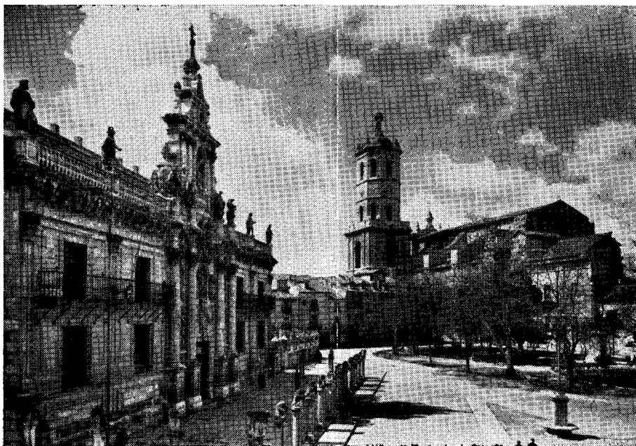
Valladolid.—La Universitato kaj la Katedralo.

La venonta Kongresurbo prezntas belajn monumentojn kaj senkomparajn artaĵojn. La tuta urbo estas vera muzeo de pasintaj tempoj kiuj skribis sur fasadoj kaj muroj sian gloran historion.