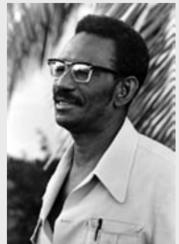
Cheikh Anta Diop va traduir la teoria de la relativitat d'Albert Einstein en llengua wòlof

L'estudiant camerunès que fa la seva carrera en francès, en anglès, en alemany, en espanyol o en italià és en una majoria aclaparadora de casos un il·lustre il·lustrat i ignorant en la seva pròpia llengua camerunesa. Quan li pregunteu: "Quina llengua parles?", us respondrà sovint: "Francès", "Anglès", "Alemany" o "Espanyol/italià", segons les disciplines. Quan insistiu dient: "Això és tot?", dirà: "Sí." Quan afegiu: "Que no tens una la llengua materna?", exclamarà: "Ah, el meu patuès! El parlo una mica." En la majoria dels casos, a penes pot tenir una bona conversa, un raonament en la seva llengua, no sap escriure i no pot llegir ni una carta, ni un poema en la seva pròpia llengua. Aquest il·lustre il·lustrat i ignorant de la seva cultura lingüística és mentrestant cridat a saber la llengua, la literatura, el pensament del món europeu o americà. No ha estat instruït en