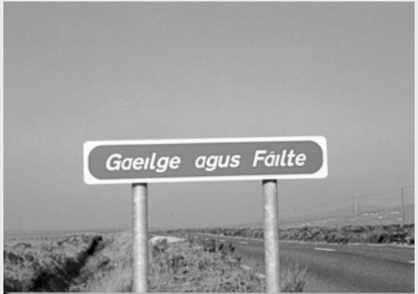
“Gaeilge agus fáilte” (literalment, irlandès i benvingut): expressió que indica que parlar en irlandès serà molt ben rebut.

Potser en el món d'avui en dia, on l'anglès americà gaudeix de superioritat, pràctica-