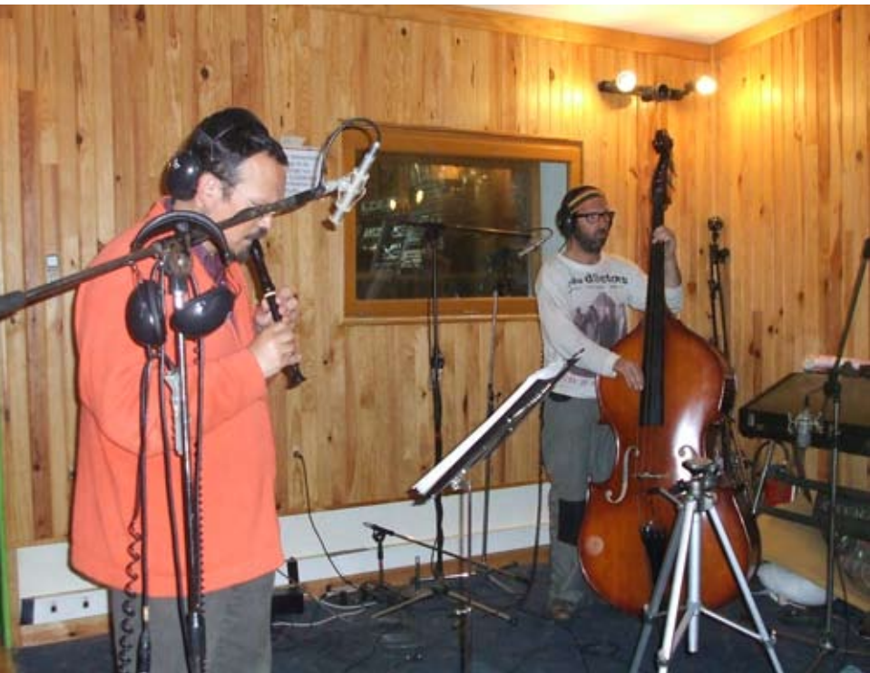
Kaj Tiel Plu surbendigas sian trian diskon