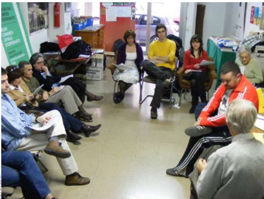
La jara asembleo de KEA okazis la 14an de marto

Vendredon la 22an de februaro 2008 okazis la jara asembleo de Centro de Esperanto Sabadell (CES) kun tre malmultaj partoprenantoj.