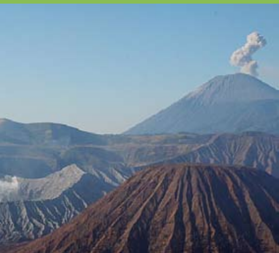
Les muntanyes Semeru i Bromo a l'illa de Java