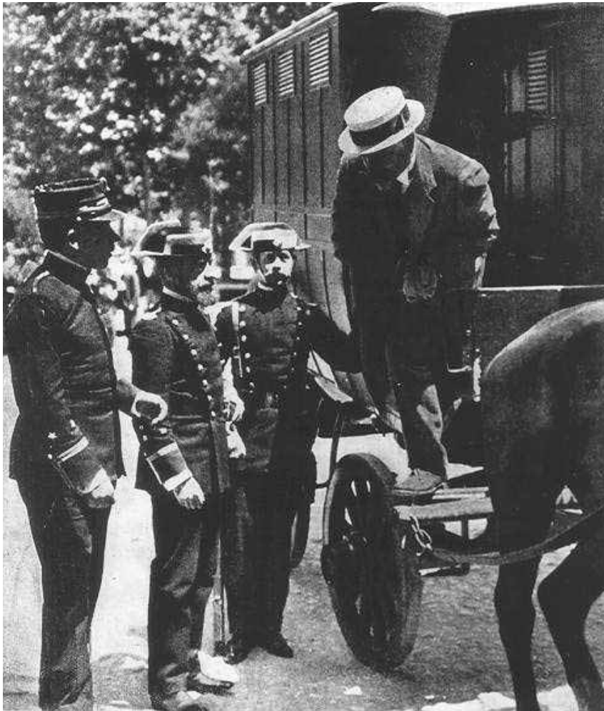
Translokigo de Ferrer i Guàrdia dum lia kaptiteco

Preskaŭ neniu publikigis la raporton de la defendo; kun la celo propagandi, la parolado de la defendo interesis neniun