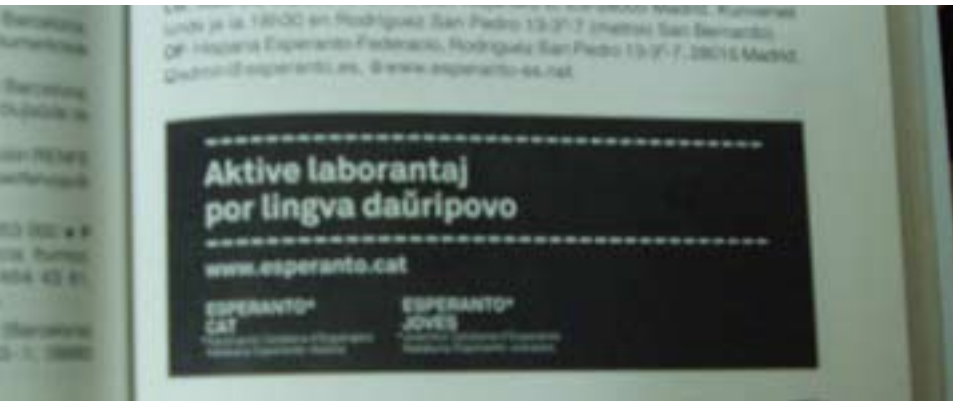
KEA volas ne nur laŭdi la lingvan diversecon, sed efektive kunkonstrui ĝin