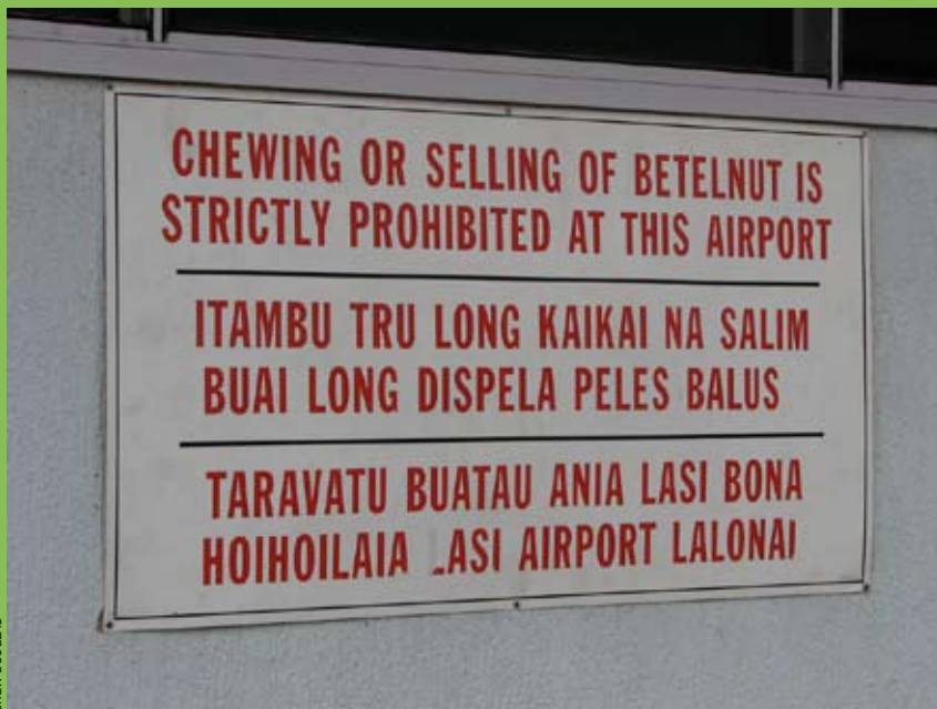
Rètol trilingüe a l'aeroport internacional de Pot Mosbi, capital de Papua Nova Guinea

Actualment, els aborígens viuen com a ocupants il·legals més o menys tolerats en el seu propi territori, i sovint han de treballar en intercanvi del privilegi de viure en la propietat d'un colon determinat.