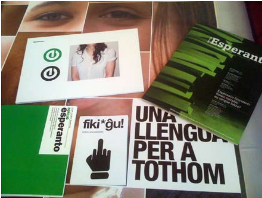
Kelkaj kreaĵoj de la lernantoj de Escola Eina