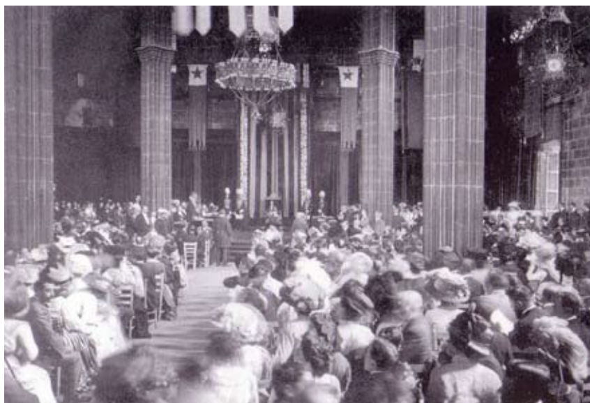
La unuaj Floraj Ludoj okazintaj en la Universala Kongreso de Barcelono mirigis la ĉeestantaron pro sia pompo

La konkurso ĉesis okazi de post 1993 pro la malnoviĝinta karaktero de la festo kaj ĉar oni