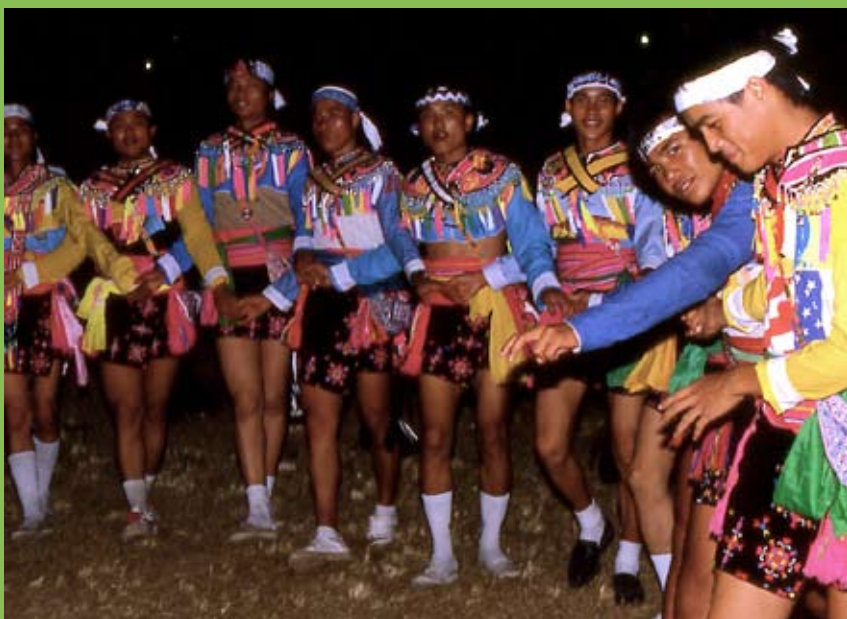
Actualment només un 2% de la població taiwanesa és d'un poble indígena. L'amis és la que té el major nombre de parlants

L'any 2000 el govern taiwanès va posar en marxa un programa d'ensenyament d'aquestes llengües natives en el marc d'un programa nacional en el qual cada escolar ha d'estudiar, a més del prestigiós mandarí –única llengua oficial–, una altra llengua: ja sigui l'anomenat taiwanès (pròxim al mandarí), el hakka (també del grup xinès) o una llengua autòctona. De moment, els resultats no mostren el capgirament la substitució lingüística a causa dels greus problemes socials dels pobles autòctons, lligats a la desaparició de les seves formes de vida tradicionals. Un informe fa posar en guàrdia sobre el fet que “molts aborígens semblen afrontar problemes socials aguts com l'alcoholisme, l'atur i la prostitució juvenil”. Tanmateix, malgrat que el nivell d'estudis dels pobles autòctons taiwanesos és per sota de la mitjana estatal, cada any 2.500 joves d'aquests pobles acaben la universitat... en mandarí, i sovint només en aquest llengua desenvoluparan la seva activitat professional.