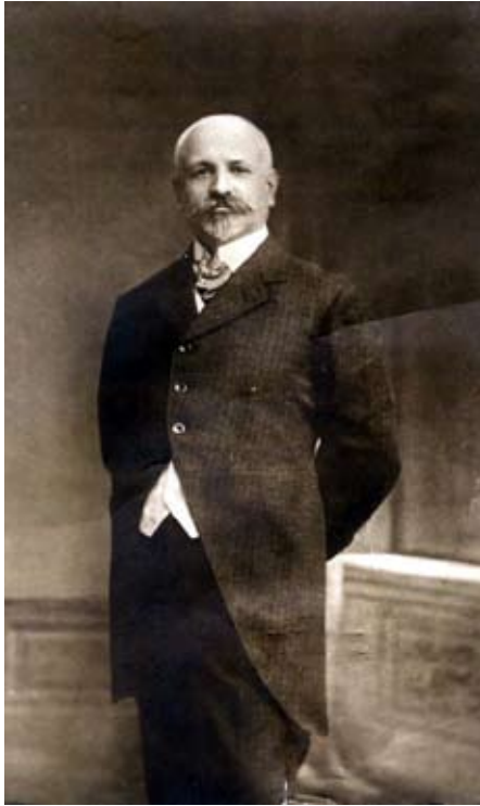
Ferrer i Guàrdia

L a 11an de julio 1909 komenciĝis en la haveno de Barcelono la enŝipigo de trupoj, cele Marokon, de multaj rezervanoj kaj filoj de laboristoj. Tuj komenciĝis ordo-perturboj sur la strato en klimato de popola koleto en la ĉefurbo kaj en la ĉefaj industriaj urboj de Katalunio. La 26an oni deklaris ĝeneralan strikon. En Barcelono, krom la propra karaktero de ribelo kontraŭ la regantoj, la movado fariĝis radikale kontraŭklerikala. La duono de la preĝejoj kaj konventoj en la urbo estis sturmitaj, pli-malpli okdek, el kiuj la duono estis bruligitaj. Okazis makabraj scenoj, kiel la profanado de tomboj, inter aliaj.