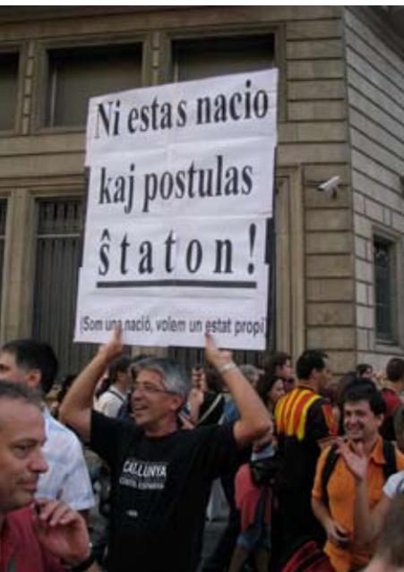
Esperantistoj ne nur varbis en budo dum la nacia tago, sed kelkaj ankaŭ aliĝis al surstrata manifestacio

kurso en somera universitato ekde la venonta jaro.