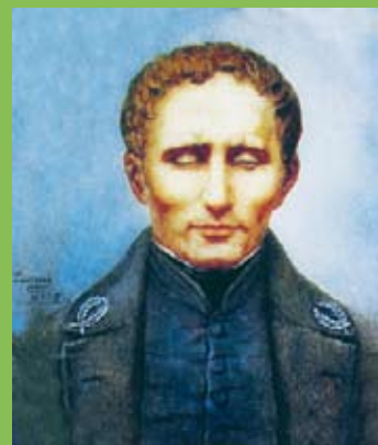
Louis Braille, retrat de Lucienne Filippi (1966). Museu Louis Braille, Coupvray (França)

A les dificultats objectives indubtables que comporta el fet de no veure-hi, o de veure-hi molt poc, se suma la presència gairebé inevitable de prejudicis i concepcions errònies