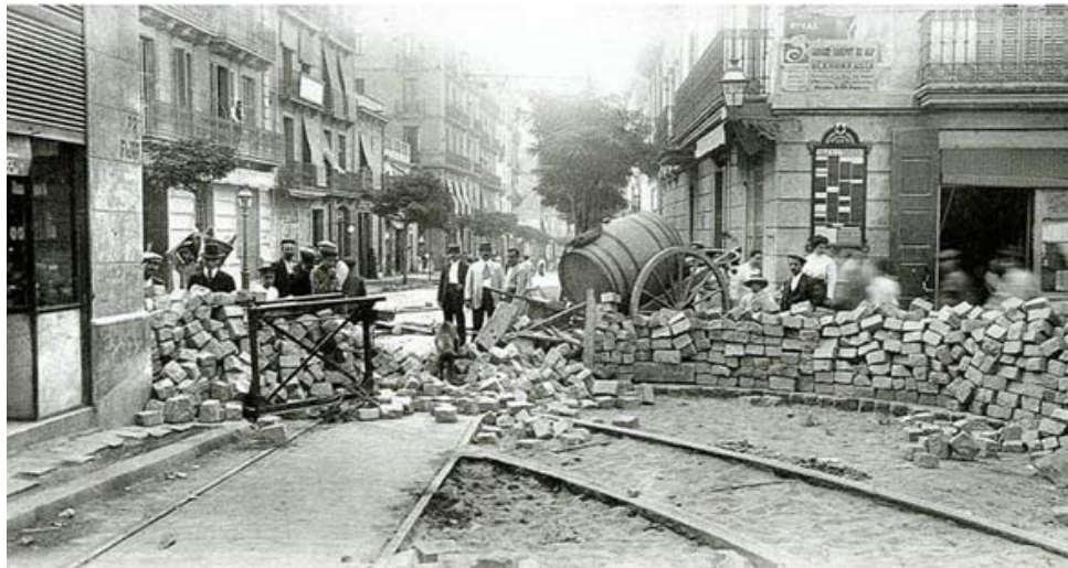
Barikado dum la Tragika Semajno en Barcelono

Tuj poste, la akuzito faras mallongan deklaron. La konsilio de milito finas je kvarono antaŭ la unua; la tribunalo retiriĝas por interkonsiliĝi. Je la sesa kaj duono oni konas la verdikton: morto-punon por la akuzito, kiun oni komunikas al li. Tuj poste oni lin rajtigas komunikigi dum horo kun la publiko; la plej proksimaj fa-