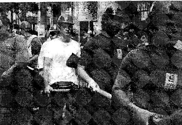
ndardoj de Grekia Komunista Partio, la manifestacion partoprenas o, kiu defendas vicajn de manifestaciantoj.