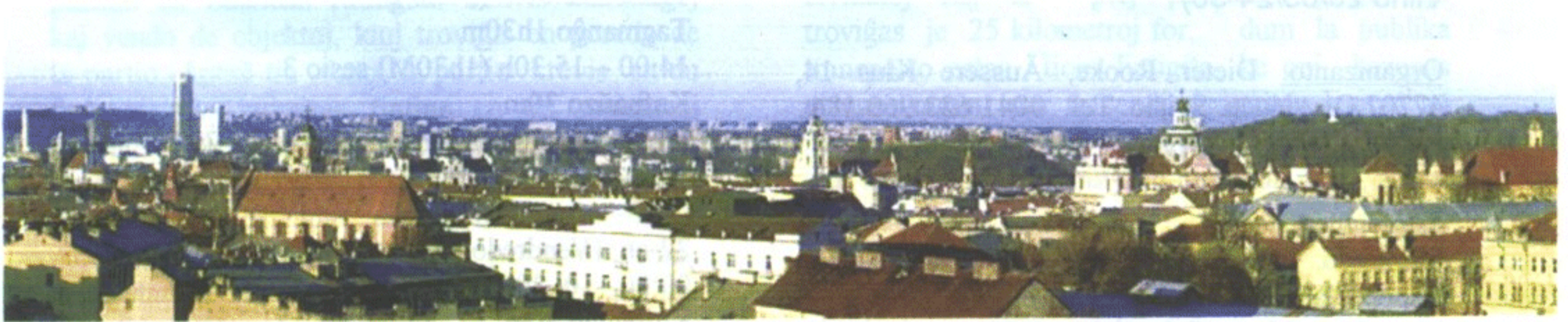
Parta vidaĵo de Vilno

N-º 2 (74) MARTO - APRILO 2005 JARKOLEKTO - 13