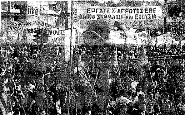
tandardoj de grekaj komunistoj inspiras ilin al la lukto.