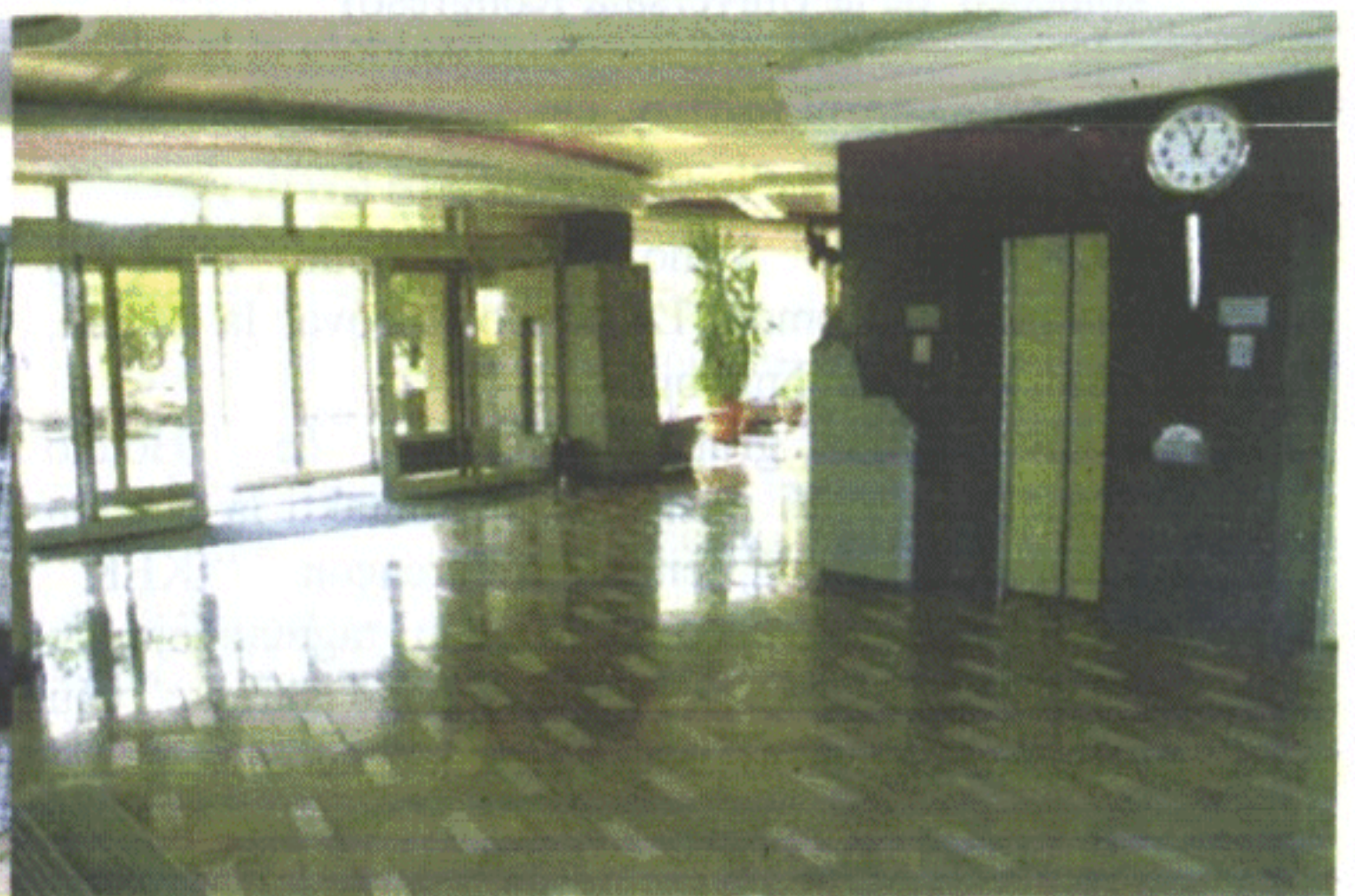
Bildoj pri Hotelo Panorama