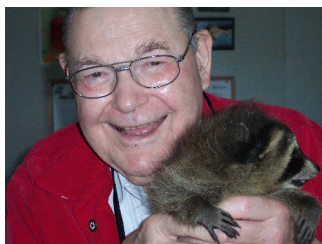
La aŭtoro kun nova amiko

lokoj de la fora arbaro. Ili ne havis patrinon por instrui, kaj ni povas nur esperi, ke la fortaj instinktoj, kiujn naturo provizis al ili, sufiĉos por ebligi ilin travivi en la natura stato.