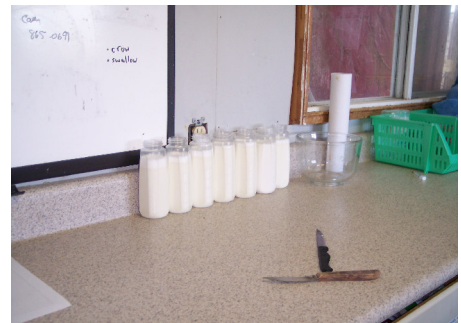
Kvarfoje ĉiutage oni pretigas la botelojn kun la receptaĵo por la suĉuloj.

Unu ŝedo estas la „suĉejo”. Tie loĝas la etaj mamuloj kiuj ankoraŭ nutriĝas per lakto. La suĉejo estas relative varma. Tie ĉiu gefratro estas en aparta kaĝo. Ĉe la kaĝoplanko estas tukoj kaj elektra varmigilo. Antaŭ ĉiu kaĝo pendas paperfolioj por priskribi la dieton, medikamenton, problemojn, kaj kiam la etaj gastoj lastatempe suĉmanĝis.