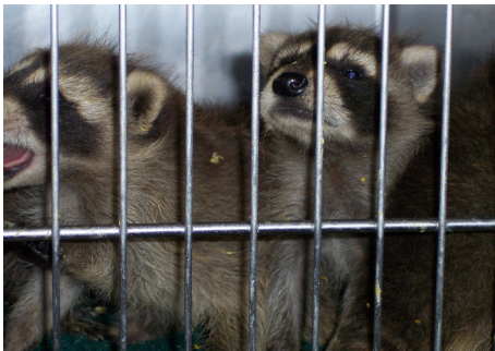
Preskaŭ tempo por suĉmanĝi. La procionidoj interesiĝas pri tio kio okazas ĉe la tablo.

Inter la bestoj en la rifuĝejo, kiam mi vizitis, estas 1 cervido, 1 kuniklo, 1 tamiido (striita sciurido), 8 ruĝaj sciuridoj, 1 nigra sciurido, 2 rakedpiedaj leporidoj, 1 mikrotido, 1 pinmarteso, 1 marsupiulo kiu alvenis de Aŭstralio, kaj 1 ruĝa vulpo al kiu unu gambo mankas. Inter la birdoj estas 8 korvidoj, 1 enorma korakido, 8 anseridoj, 1 nigra viransero, 4 rubekolidoj, 2 vintraj emberizidoj, 1 paserido, 2 strigidoj, 8 kolombidoj kaj proksimume 30 sternidoj. La precizaj nombroj ŝanĝiĝas preskaŭ ĉiutage.