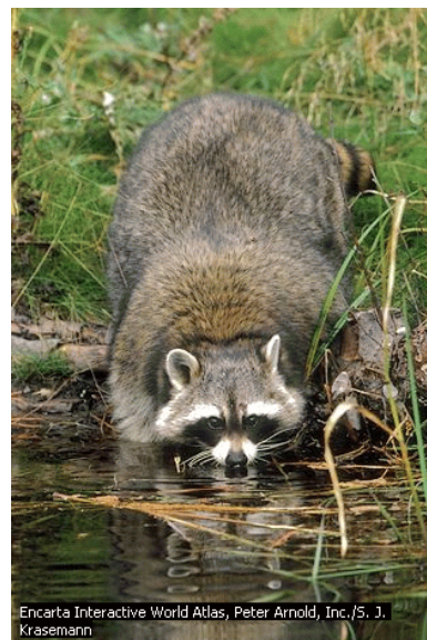
Encarta Interactive World Atlas, Peter Arnold, Inc./S. J. Krasemann

Imagu! Kvindek kvin etaj ŝtelistoj en unu loko. Tion, inter aliaj aferoj, mi vidis kiam mi lastatempe vizitis la Orientmarbordan Centron por Rebonstatigo kaj Savo de Sovaĝbestoj [Eastern Shore Wildlife Rehabilitation and Rescue Centre] en la eta vilaĝo Seaforth, je kelkaj kilometroj oriente de Halifax-Dartmouth. Tie, en kaduka farmdomo kaj kelkaj neimponaj garbejoj kaj ŝedoj loĝas proksimume cent tridek kvin kriplaj birdoj kaj mamuloj kaj orfaj idoj. Teamo de vartantoj, kiuj senpage donas