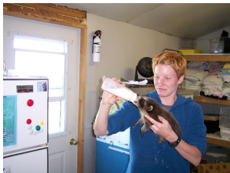
Oni devas disponigi botelon de la nutraĵo al la procionidoj unuope. Imagu la kvanton de la laboro!

Oni manĝigas la procionidojn kvarfoje ĉiutage. Oni pretigas la botelojn de lakto modifita laŭ recepto, plimalpli same kiel por la homaj beboj. La vartanto nutras ĉiun bebon individue. Kiam unu procionido estas kontenta, oni metas ĝin en korbon kaj atentas la gefratojn. Kiam ĉiuj de unu kaĝo estas nutritaj, oni purigas la kaĝon, reenmetas la suĉintojn por dormeti, kaj turnas la atenton al la sekvanta kaĝo. Feliĉe, unu botelo da receptaĵo kutime sufiĉas por pli ol unu ido.