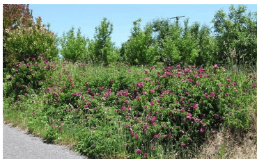
Figuro 4: Resovaĝintaj rozoj apud vojo en Adelaide Hills

Ĉu necesas ilin savi? Jes, kaj rapide; tro-netigemuloj forfosas ilin el tombejoj kaj ĝardenoj de detruotaj domoj, aŭ ŝpruc-venenas ilin apudvoje. La originalaj plantoj de kelkaj miaj trovitaĵoj jam malaperis. Greffitaj rozoj povas esti estingitaj per ŝosoj el la baztrunko. Alia danĝero estas la emo de ĝardenistoj, ĉiam deziri ion pli modernan, aŭ rozarbuston, kiu floras de printempo ĝis la komenco de vintro. La plej multaj roz-specioj, kaj „Malnovaj Eŭropaj” roz-varioj, floras nur printempe. Pli longa roz-florado alvenis al Eŭropo ĉefe per bredado kun rozoj el Ĉinio kaj poste Japanio, ekde la frua 19a jarcento. Ĉefe Te-rozoj floras dum la tuta jaro.