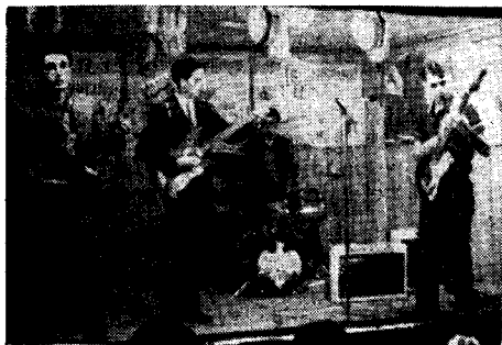
«Los chicos Cantores», el la Grupo Diamanto de Madrid