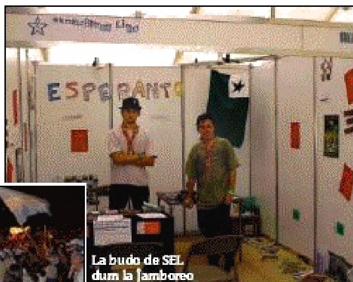
La budo de SEL dum la Jamboreo