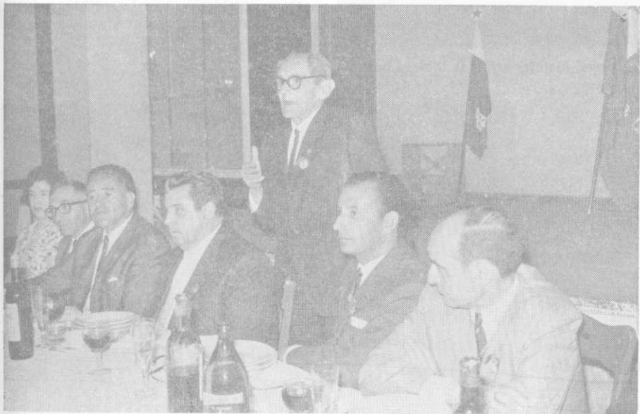
Dum la Bankedo S-ro Cienfuegos salutas la kongresanojn.

La revendevo kondukis nin rekte al Leon, kie ni restis ĝis post la tagmanĝo. Ni vizitis la katedralon, monde konatan, kies konsisto mirigas tiel la nefakajn kiel la fakajn vizitantojn: Koloroj starantaj ne tute vertikale por kompensi la dispuŝon de la volboj; vitraloj kaj vitraloj, koloroj kaj koloroj; la lumo tra ili prezentas magiajn ludojn. Nenie oni kovris tiom da spaco per tiel malmulte da materialo. La gvidisto rakontandis ne nur per simpla prozo sed ankaŭ per poezio pri meritoj, homoj, datoj, historieco... Kiu