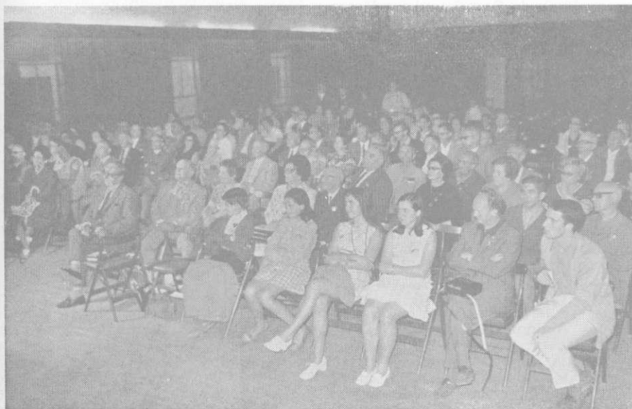
Partoprenantoj en la Ĝenerala Kunsido de H. E. F.

La 21an de julio. Matene okazis la Ĝenerala Kunsido de nia Federacio.