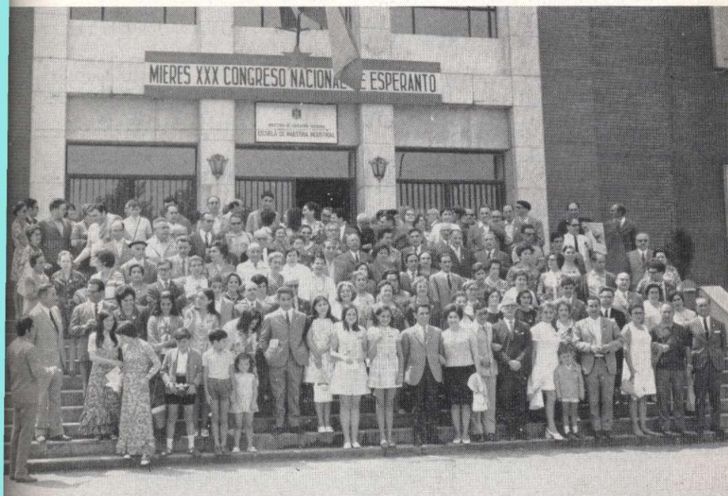
Grupo de partoprenantoj en la 30.ª, post la solena inaŭguro