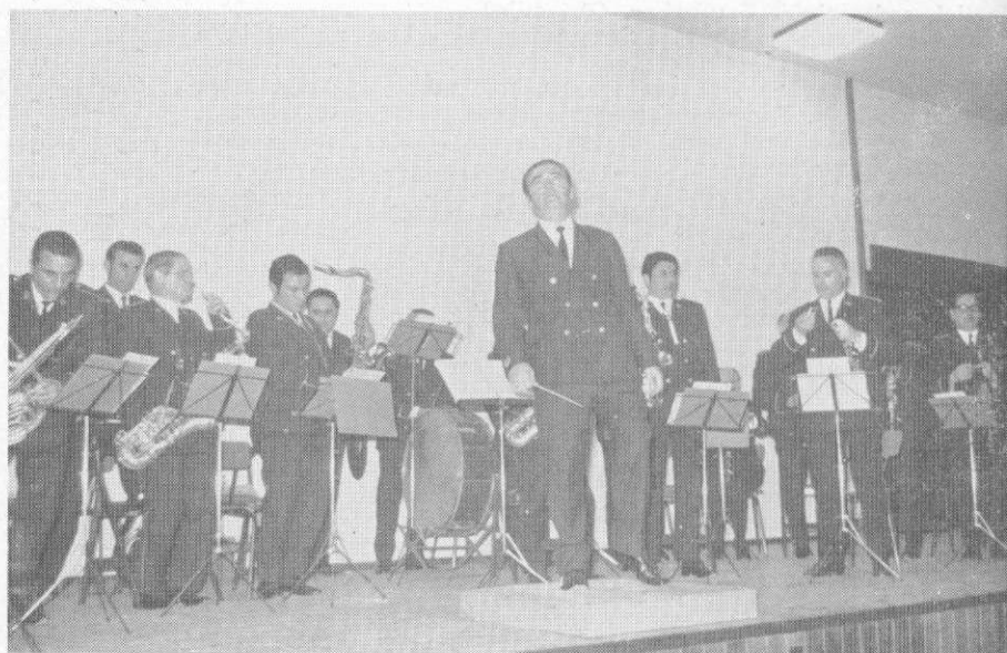
Ĥoro kaj Muzikistaro de Mieres, kiuj regalis nin per tre bela koncerto.