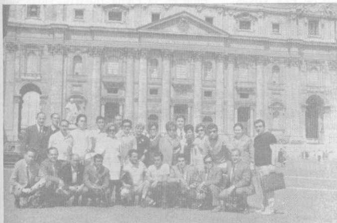
Hispana Esperantista grupo kiu partoprenis la I.F.E.F.-kongreson en Rimini.