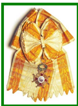
Emblemo de Ordeno de Izabel