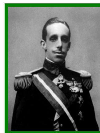
Reĝo Alfonso XIII