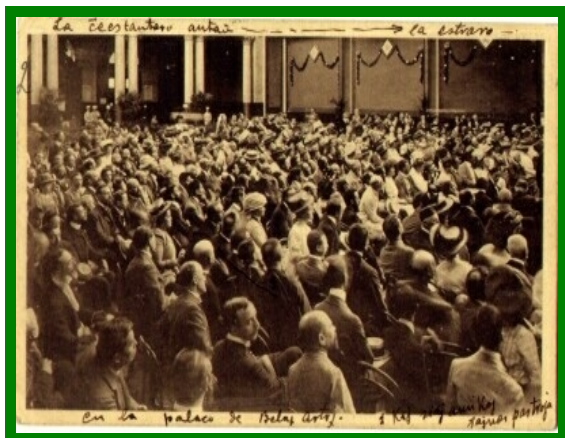
Solena Malfermo de la 5-a UK (1909)