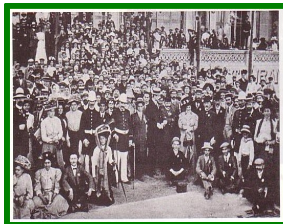
Kongresanaro en Barcelono (1909)