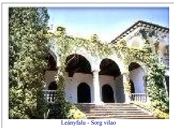
Leányfalu - Sorg vilao

Lulu min melankolia riverondo, Birdo kantu sur prajuglando, Floranta montet' min kovru, Dum zefiro milde blovu! Ω