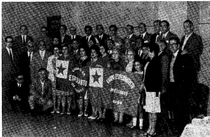
Unua Astura Esperantista Kunveno