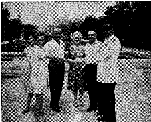
S-ro Lorenzo Til kun internacia grupo.