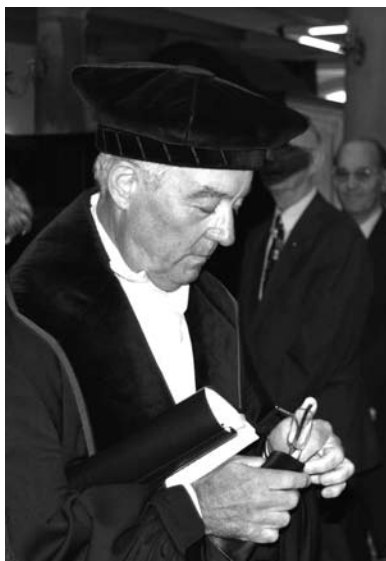
post la prelego

La katedro prezentas lingvosciencan instruadon de interlingvistiko kaj lingvo-instruadon de Esperanto. Esperanto estas serioza fenomeno, kreita kaj kreata de homoj. Tiu proceso meritas atenton en la lingvoscienco. La Universitato de Amsterdam evoluu al centro de scioj pri internaciaj lingvo-problemoj. Centro, kiun politikistoj kaj aŭtoritatoj ne povas neglekti por sia plando.