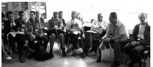
kunveno de Afrika Komisiono

La ceremonioj finiĝis per kuna kantado de La Espero. Poste estis tempo por fotado.