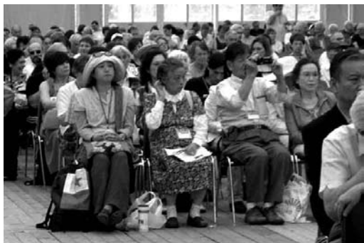
la solena malfermo

Dimanĉo estis la tago de la solena malfermo. La malfermaj ceremonioj estis la sola antaŭ-tagmeza programero, do preskaŭ ĉiuj kongresantoj ĝin partoprenis. La ceremonioj komenciĝis je la 10-a horo kaj devis finiĝi tagmeze. Mi prezentis min por saluti nome de asocio. Montriĝis ke ĉiuj homoj kiuj salutas por siaj landaj asocioj, devas sidiĝi sur la podion malantaŭ la estraranoj. Tie estis preparitaj seĝoj kun skribitaj nomoj de landoj.