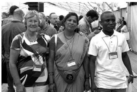
esperantistoj el Nederlando kaj Sudafriko

Son-teknikistoj videble teknikumadis sed sen rezultoj. Mi aŭdis iujn demandinte, ĉu iu havas KD-on kun muziko. Ni iom atendis, sed finfine nenio okazis, do mi devis iri al mia dormejo. Kia junulara vespero!