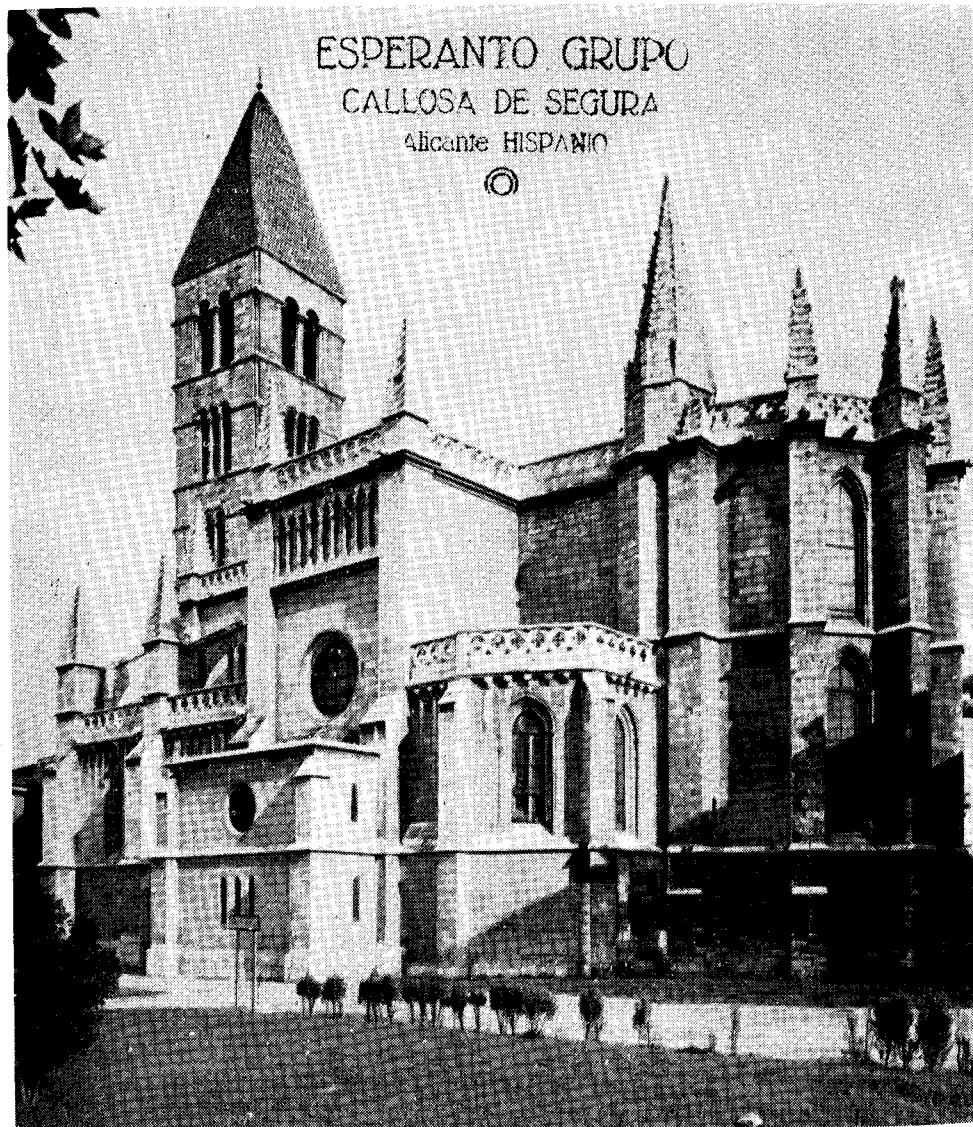
Preĝejo «Santa María la Antigua»