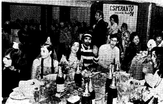
Parta vidaĵo de la Hotelo Urpi dum la festo.