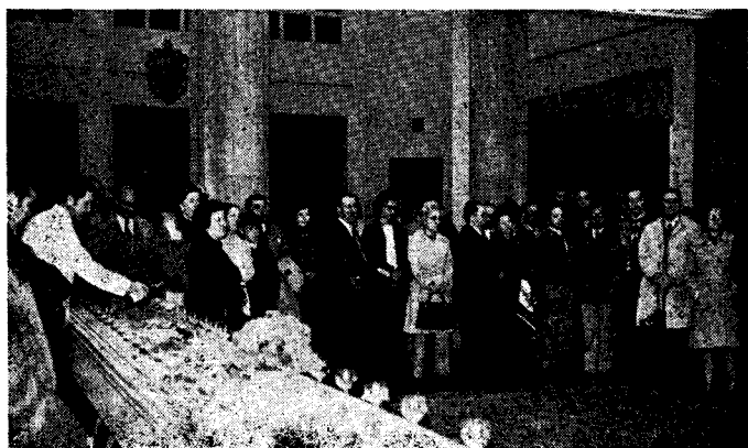
Parto de la esperantistoj dum la Oficiala Akcepto en la Urbodomo.