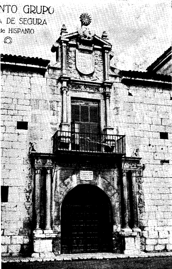
«Casa del Sol» (s. XVI)

ESPERANTO GRUPO CALLOSA DE SEGURA Alicante HISPANTO