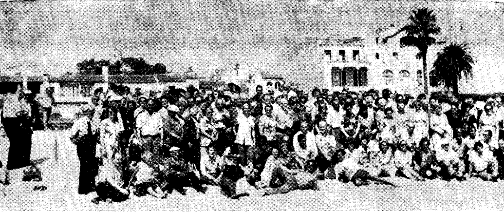
Grupo da partoprenantoj en la Postkongreso

Pere de nia H.E.F.-a Bulteno, intencas mi sciigi ĉiujn interesatojn pri la diversaj okazintaĵoj, okaze de la I.F.E.F.-a Postkongreso en Calella. Mi priskribos, laŭde, la diversajn aktojn kaj ekskursojn.