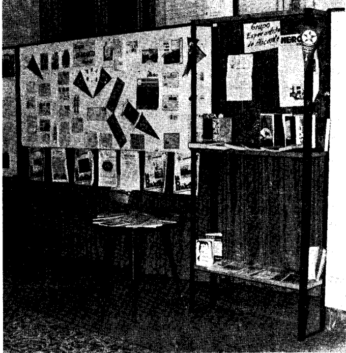
Angulo de la Esperanto Ekspozicio.

kortuŝaj vortoj, S-ro Veiga Prego dankis la decidon de la hispana esperantistaro. Entuziasmaj aplaŭdoj metis finan punkton al la aranĝo.