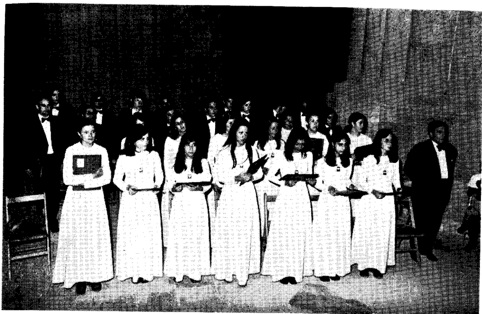
«Coral Sicoris» partoprenas en la Meso en Esperanto.