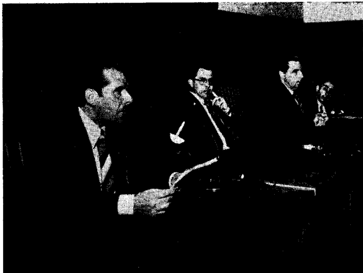
Sro. Mora i Arana prelegas.

funkciadon de la maŝinoj kaj la evoluon de la produktoj. Post la vizito oni regalas nin per biero kaj manĝetoj.