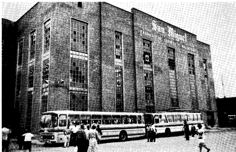
Antaŭ fabriko «San Miguel» kongresanoj atendas la alvenon de pliaj aŭtobusoj.