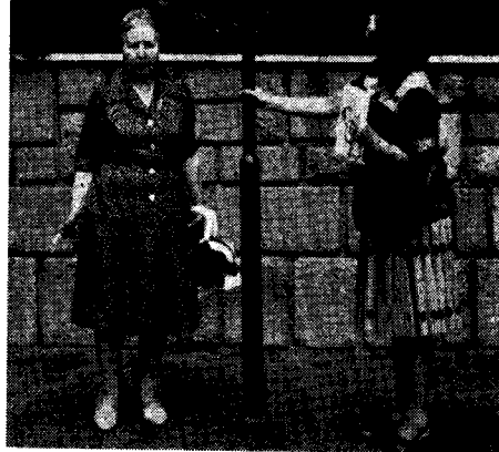
Esperantistinoj de Gijón kaj Zaragoza en Roma

Ĉar la 16-a estis destinita por viziti la insulon Capri, por pli bone profiti la tempon, ni decidis veturi ĝis Nápoles, nokte. Sekve, la 15-an vespere ni translokiĝis al Tivoli por viziti ĝiajn famajn ĝardenojn, sed, malgraŭ nia granda deziro ilin viziti, ni ne tion sukcesis; dum la monato aŭgusto ili estas fermitaj. Komprenoble, ni profitis la tempon vizitante ĉion vizitandan en Tivoli, krom ŝiajn famajn ĝardenojn, kaj trukurante ĝiajn stratojn. Fine, ni vespermanĝis en tipa restoracio, kaj estis jam