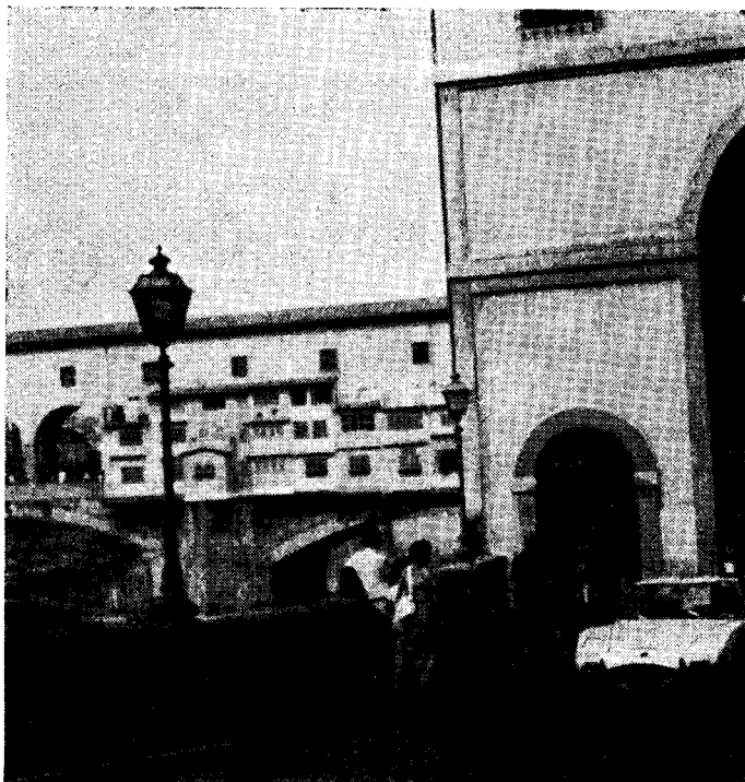
Niaj gesamideanoj admiras la pitoreskan ponton «Vecchio» en Florenco.

La 10-an matene ni vizitis la centran parton de la urbo kaj ties artaĵojn: Santa Maria Novella, la placo de l' Duomo... La beleco de la katedralo ne estas facile priskribebla, ĝia Baptisterio... Se la placo de l' Duomo estis la plej grava religia centro de la antikva Florenco, la placo de la "Signoria" estis la centro de la politika vivo de la urbo, en ĝi ĉiujare oni revivigas scenojn de la mezepoko. Inter la pluraj pontoj sur la rivero Arno, elstaras la pitoreska "Vecchio" per siaj domoj super la rivero. La palaco de familio Medici, centro de la itala kulturo kaj la grandioza konstruaĵo de Pittis, elmontras la antagonismon inter tiuj du familioj.