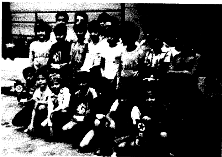
Colegio La Salle- Antúnez. Esperanto-kurso.

La kursanoj estas pretaj korespondi kolektive kun gelernantoj de aliaj lernejoj en la tuta mondo. Jen la adreso: Colegio Salle-Antúnez-Kurso de Esperanto— Luis Antúnez, 37 — Las Palmas de Gran Canaria, Hispanio.