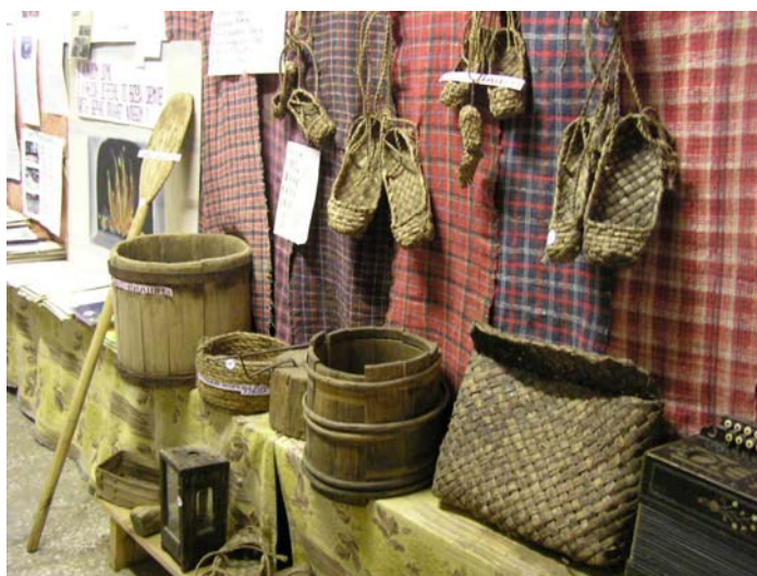
La bildoj montras udmurtan domparton ekstere kaj interne

La ritoj estas bone konservitaj precipe inter vilaĝanoj, ĉar en vilaĝoj plimulto da loĝantoj estas udmurtoj. Tamen reprezentantoj de aliaj nacioj, kiuj loĝas apud Udmurtoj, estime rilatas al la tradicioj de Udmurtoj kaj entuziasme partoprenas festojn de la Udmurtoj.