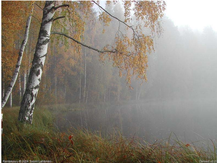
Ősz Finnországban / Aŭtuno en Finnlando