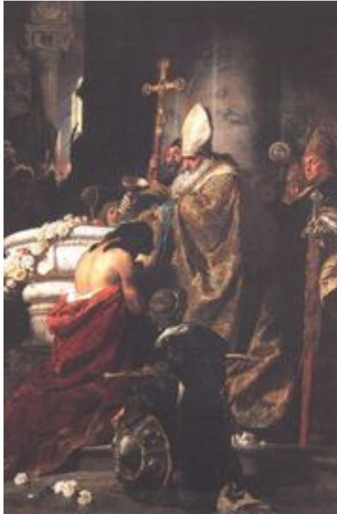
Benczur Gyula: Vajk megkeresztelése

Fiaának Istvánnak a bajor hercegi házból való Gizellát szerezte meg feleségül, ezzel nyugati kapcsolatait egyengette.