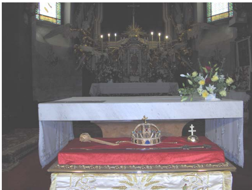
Hungaraj kronadaj juvelobjektoj ( landpomo, sceptro, krono ) prezentitaj en la miŝkolca rom-katolika preĝejo Mindszenti / Mindsenti / , la 22-an de julio 2006.