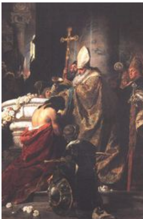
La bildo montras pentraĵon de Gyula Benczur / Julio Benczur/: Bapto de Vajk

Por sia filo Stefano li akiris edzinon Gizella, el la reganta princa familio de Bavario .Per tiu paŝo li glatigis siajn okcidentajn interrilatojn.