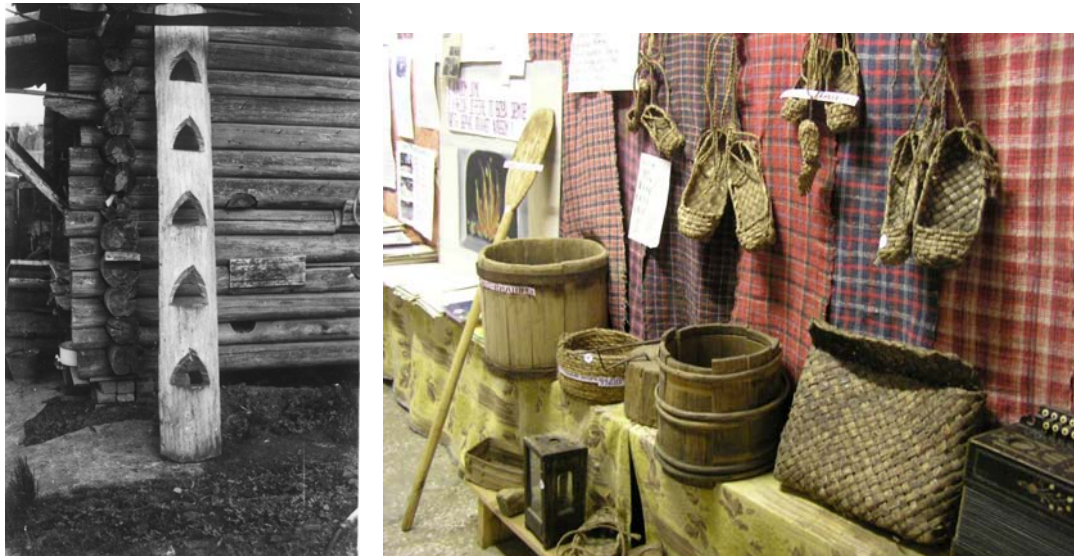
A képek udmurt ház részt mutatnak kívülről és belülről

A legértékesebb rítusa a karneváli öltözködésnek van. Népszerű az ifjúsági öszejövetel is. Az és a november végén - december elején tartott őszi ünneppel végződik— Szent Katalin vagy Szent Miklós napján.