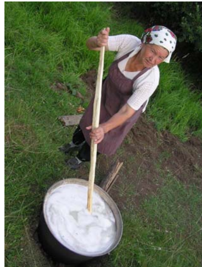
La bildoj montras la festantojn, kaj la pretigon de la festa manĝaĵo

En fino de majo la Udmurtoj okazigas feston okaze de pompe ekflorintaj plantoj. Se ĝis tiu tago estas malpermesita rompi branĉojn de arboj, arbustoj, falĉi, do tiun tagon oni plibeligas siajn domojn, somerajn kuirejojn kaj aliajn konstruaĵojn per branĉoj de betulo, acero, paduso k.a. La festo estas okazigata en sino de naturo, en arbaro. Nuntempe tiu ĉi festo estas ligita al Pentekosto. En vilaĝoj tiu ĉi tago komenciĝas per vizito de preĝejo. En iuj vilaĝoj oni vizitas tombejon. La junularo la tutan antaŭpentekostan nokton pasigas apud balanciloj instalitaj dum Pasko: ludas, kantas, lastan fojon balanciĝas sur la balanciloj. Dum la mateniĝo oni disrompas tiujn balancilojn kaj aranĝas lignofajron, renkontante sunleviĝon. Poste oni iras en arbaron por la branĉoj por ornami domojn.