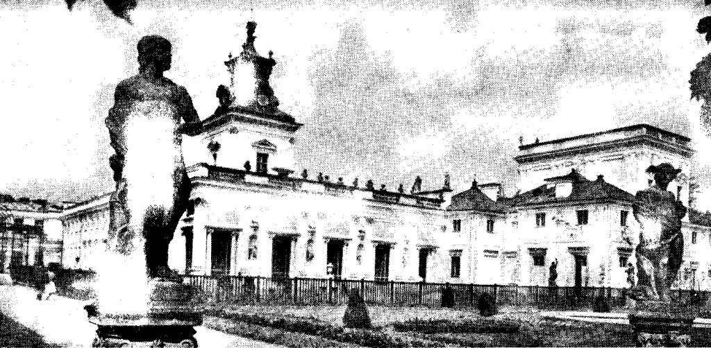
Palaco de la XVII-a jarcento en Varsovio

mankis tempo por ĉion detale vidi, ĉar ni restis tie nur unu tagon. La impona katedralo de Wawell, ĉirkaŭita per 18 kapeloj enhavas la tombojn de la ĉefaj polaj reĝoj kaj mirigas la vizitanton pro la beleco de la altaroj kaj aliaj ornamaĵoj; la malnova urbo estas vivanta muzeo kun preĝejoj kaj civilaj konstruaĵoj de ĉiuj stiloj kaj speciale la ĉefa placo kun la gotika konstruaĵo de la Collegium Maius meritas specialan mencion.