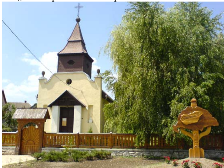
Sentempeco – Kisgyőr

Nia sekva ekspozicio estos la 21-an de majo 2008, je la 17-a horo en vilaĝo Kisgyőr en la Vilaĝdomo, kie la foto „Sentempeco” estos ekspoziciita.