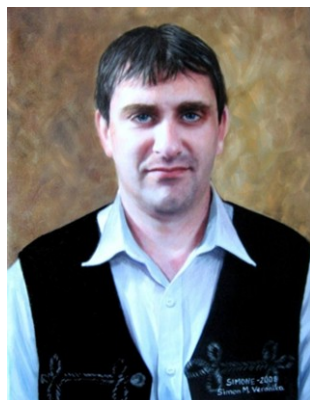
La fotopentraĵo estas verko de Veronika Simon M.

Nun ekkonatiĝu kun ŝia edzo, kiu estas prezidanto de Reta Societo de la Hungaraj Kreantoj.