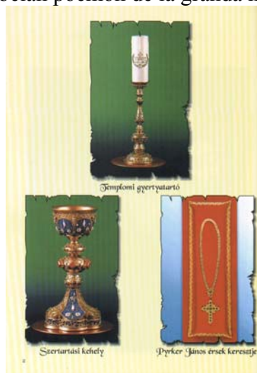
Kopcsik Marciapanio en Eger

Okaze de tiu tago vi povas legi belan poemon de la granda hungara poeto: