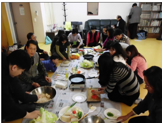
Leciono pri farado de koreaj patkukoj

Ni buse veturis al la Ŭonbulisma Templo en la urbo Iksan, kie multaj homoj kun grandaj kaj malgrandaj aŭtoj estis atendantaj nin. Ĉar nia grupo estis granda kun multaj pakajoj, ni devis laŭvice nin ŝtopi en la aŭtojn. Estis ĉirkaŭ la 11a nokte kiam ni atingis la cel-lokon.