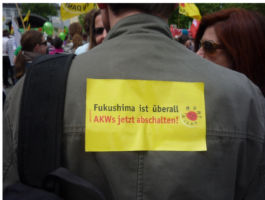
Fukushima estas ĉie: malŝaltu atomcentralojn tuj! Manifestacianto en Germanio

En junio 2011 la sama registaro malŝaltigis 8 centralojn kaj deklaris, ke la restaj 9 sekvos ĝis 2022.