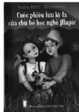
Hlapiĉ en la vjetnama