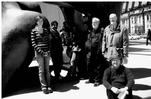
Ekskursanoj antaŭ la Arta Galerio de Ontario