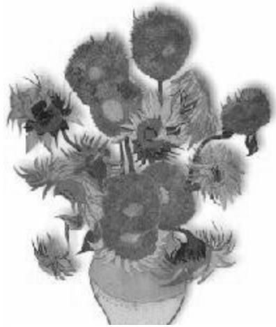
Pentraĵo de sunfloroj far Vincent van Gogh.