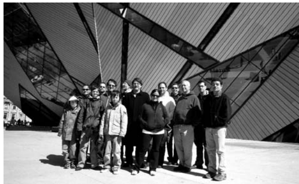
Partoprenantoj de la ekskurso al torontaj arkitekturaĵoj antaŭ la Reĝa Ontario Muzeo

Dimanĉe la vetero estis bela, kvankam kun iom malvarma vento. En la mateno iuj kune brunĉis * en restoracio Daybreak. Aliaj, jam manĝintaj en siaj pensionoj aŭ hoteloj, mem esploris la ĉirkaŭaĵon. Post la manĝo ni rekunvenis en la festoĉambro por dividiĝi en grupojn por fari la elektitajn promenojn/ ekskursojn. Iuj iris al 'AGO', la Arta Galerio de Ontario. Aliaj ekskursis kun Skoto piede kaj trame por rigardi konstruaĵojn de arkitektura vidpunkto en la universitata kaj aliaj kvartaloj.