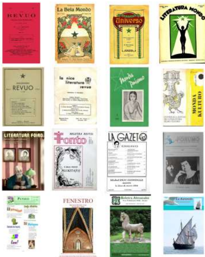
De 1905 ĝis nun, neniam ĉesis aperi beletraj aŭ kulturaj revuoj en Esperanto.

tute alian formon aŭ eĉ ne ekzistus. Oni povas eĉ aserti, ke Esperanto entute estas lingva poemo, kiun Zamenhof komponis omaĝe al la kreema spirito de la homaro. 14