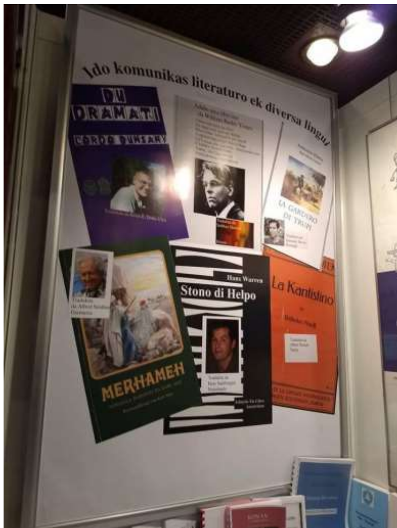
Ekspozicio de modernaj Ido-verkoj en Expolingua Berlin (2018-11-16).