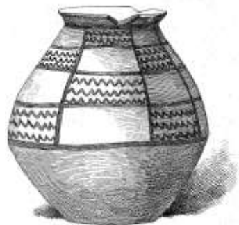
III. — Vas. Terre cuite jaune. Hauteur, 0,28. Cabinet Égyptien. Musée de Louvre.

Nek arto nek poezio estis do fremdaj al Couturat. Ĉu tiajn ŝatojn li transprenis en la novan lingvan projekton, kiu poste fariĝis stabila lingvo? Nu, ŝajne io okazis inter la studenta kaj la maturaĝa periodoj de la filozofa matematikisto, ĉar en 1907