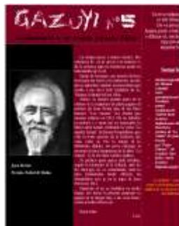
La lasta numero de Gazuyi , aperinta en januaro de 2012.