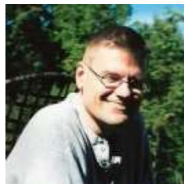
Brian E. Drake, tre produktema kaj entreprenema usona Ido-verkisto plurĝenra.

Drake, cetere, fariĝis unu el la plej produktemaj Ido-verkistoj nuntempaj. 136 Krom la tri menciitaj romanoj, eliris el lia ateliero ankaŭ du novelaroj ( Nokto-gardeno , 2014; Pagini trovita en fango , 2018), teatraĵo ( La Krulo di la domo di le Usher , 2018), du versaj dramoj ( La kano-tranchero , 2019; La fantomo vivanta , 2019) kaj du poemaroj ( Poemeti por puereti , 2018; Astoneso , 2018). Krome, en lia dika (222-paĝa) anglalingva poemaro Collected Poems 1976–2016 sidas ankaŭ naŭ originalaj Ido-poemoj. Krome li idigis impresan kvanton da literaturaĵoj plurĝenraj, precipe el la angla, sed ankaŭ el la franca. 137 Aldone, li publikigis ankaŭ plurajn filmetojn kun