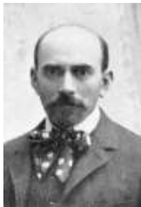
Leo Belmont (1865–1941), aŭtoro de la unua publikigita esperanta poemo nezamenhova (1888) kaj lanĉinto de la unua radiko ne enkondukita de Zamenhof ( mebl/ ).

Ankaŭ en la posta projekto, Lingvo Universala (1881–1882), laŭ la malmultaj postlasitaj manuskriptoj, oni trovas du poemojn, el kiuj unu estas tradukita ( Balladdo , de Heine) kaj la alia, originala ( Pinto , "Penso"). 6 Fine, ankaŭ en la t.n. Unua Libro de la Lingvo Internacia de D-ro Esperanto (1887) sidas tri poemoj, el kiuj unu estas tradukita (la antaŭe menciita balado de Heine) kaj du, originalaj: Mia penso (reverko de la antaŭa Pinto ) kaj Homia kor '. 7 Krome, la gravecon atribuitan de Zamenhof al lingvo internacia kiel perilo de literaturaĵoj montras ankaŭ lia antaŭvido, en la antaŭparolo de la Unua Libro, ke per enkonduko de tia lingvo "Falus la ĥinaj muroj inter homaj literaturoj". 8