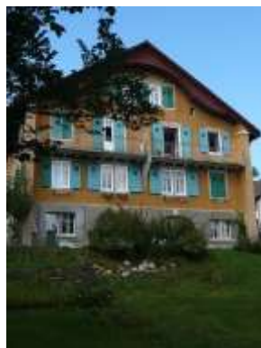
Dorsa (alĝardena) fasado de KCE en Ĉaŭdefono.