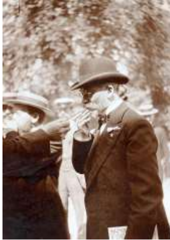
Zamenhof estis ĝisosta fumanto. Sur la foto iu ekbruligas al li cigaredon okaze de Esperanto- aranĝo en Frankfurto (1906).

dediĉitan al sia patro ( patri meo ), alian, tre dikan, en la franca, 23 ambaŭ sukcese defenditajn samjare kaj samtage, 24 profesoris en pluraj universitatoj kaj, malkiel Zamenhof, neniam devis barakti por vivteni sin. 25 Zamenhof difektis sian sanon per obstina fumado, 26 dum Couturat estis antitabakisto, kion montras ekzemple lia artikolo Veneneso di la tabako , en kiu li asertas i.a., ke “ĉiaj pruvoj pri la malutileco de tabako malhelpos nenium sorbi tiun venenon, tiom forta estas la stulta kaj naŭza kutimo, pruntita disde la sovaĝuloj de