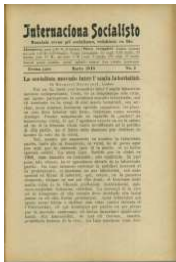
La 3a numero de la 3a jarserio (marto 1910) de la monata revuo Internaciona Socialisto .

Meze de 1909, recenzante la majan numeron de Internaciona Socialisto , li mencias ankaŭ, sen malfavora komento, la teatraĵon “ Hamlet (la fama monologo: ‘Esti aŭ ne esti...’) tradukitan de D-ro O. Liesche”. 53 Do ankaŭ poezio nun rajtas aperi en Ido... se tradukita. Fine de la sama jaro, recenzante la 7an numeron de Idano (nova nomo de Germana Ilisto ), li unuafoje eldiras laŭdon pri versa traduko en Ido: “ Apud la Weser (kanzono kantita de S-ro Beiche en Cöthen). La traduko estas tre ĝusta: malofta kvalito en versa traduko!” 54