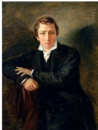
Heinrich Heine (1797–1856) estas unu el la unuaj poetoj tradukitaj en Esperanto — de Zamenhof en Lingvo Universala (1881) kaj en la Dua Libro (1888) kaj de E. de Wahl en La Esperantisto (1889) — kaj la unua tradukita en Progreso (1912).

Jam en 1913, recenzante la trian numeron de la tria jarserio de Idealisto , Couturat plendas, ke la gazeto “estas ĉi-foje inundita per poeziaĵoj de kelkaj eminentaj samideanoj. Tio estas bedaŭrinda simptomo, ĉar tio estas forgeso de la ĉefa kaj esenca celo de la L.I. helpanta ”. 71 Couturat tuj citas la aŭtorojn de tiuj tradukoj, kiuj sentis la bezonon pravigi sian aŭdacon (“kvankam ni devas apliki kaj disvolvi nian lingvon en