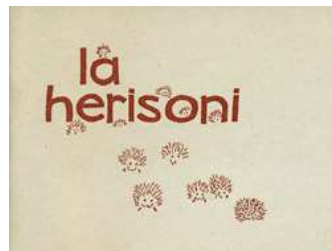
Unu el la Ido-tradukoj de Stuijbergen: La herisoni (1999), de la nederlanda verkistino Rymke Wiersma (n. 1954). Originala titolo: De egeltjes (1983).