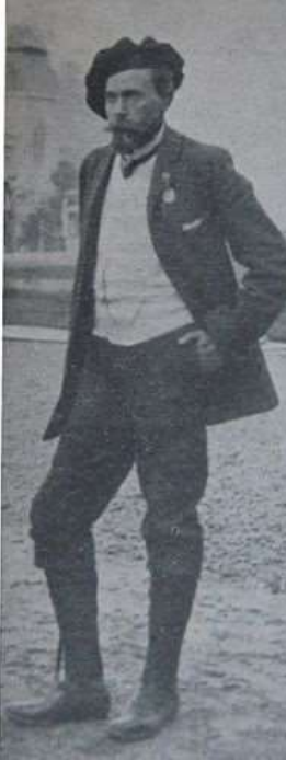
Vasilij Devjatnin (1862– 1938), tradukinto de Demono .