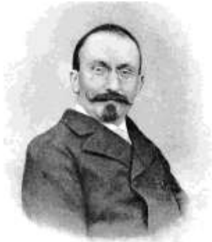
Louis Couturat en 1910.

de la diskutoj, esploroj kaj decidoj, per kiuj la projekto Ido ellaboriĝis kaj lingviĝis inter 1908 kaj 1914.