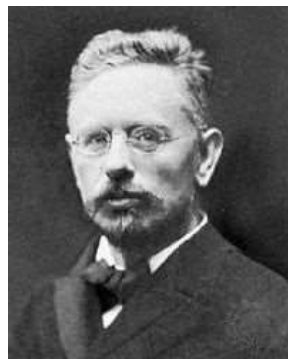
Otto Jespersen (1860–1943), dana lingvisto, bele idigis poemon de Goeto (1914).