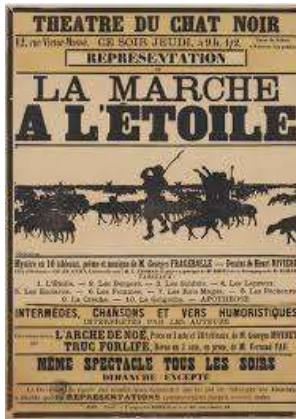
Afiŝo pri La Marche à l'étoile (ĉ. 1890).

supérieure —, ni scias, ke en 1890, kiam ambaŭ prepariĝis por la agregacia ekzameno, Couturat kutimis gajigi la etoson de ilia studenta ĉambro (france: turne ) per deklamado de poemoj de la latina poeto Horacio kaj sonetoj de José-Maria de Heredia (1842–1905), kubdevena franclingva poeto, kaj per kantado de esprimoplenaj rimoj el La Marche à l'étoile , teatraĵo pri la altira forto de la Betlehema stelo, aŭtorita de la franca muzikisto Georges Fragerolle (1855–1920), kiu premieris en 1890 en la pariza kabaredo Chat Noir kaj poste fariĝis furoraĵo (500 turneaj prezentoj!). Laŭ la sama atesto, ni scias ankaŭ, ke Couturat estis fervora leganto de la greka filozofa Platono kaj de la latina filozofa poeto Lukrecio, pri kiuj li “volonte ripetis” 29 jenajn versojn de la franca poeto Sully-Prudhomme (1839–1907), kiu Nobel-premiigis en 1901: