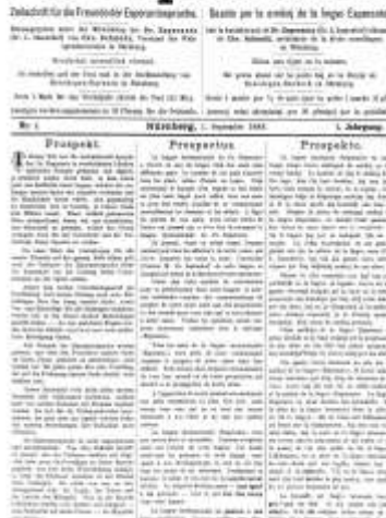
La unua numero de La Esperantisto (1889-09-01).