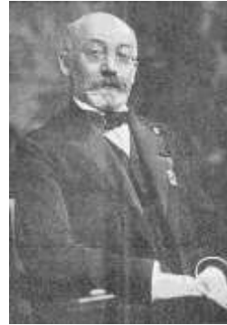
L. L. Zamenhof en 1910.

Ĉu en sia lingvokonstrua laboro Couturat, kiu konatiĝis kun Esperanto en 1900, 19 gvidis sin per la samaj principoj kiel Zamenhof? Nu, tio apenaŭ estus ebla, ĉar la du aŭtorojn disigas gravaj diferencoj koncerne familian etoson, kulturalan atmosferon, loĝlokon, universitatan edukiĝon, kutimojn kaj eĉ vivtenajn