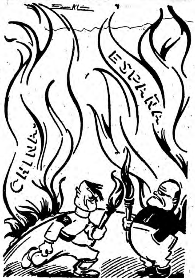
Musolini k Hitler lumigas la mondon.