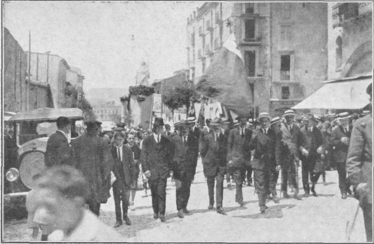
En direkto al la Urbdomo.