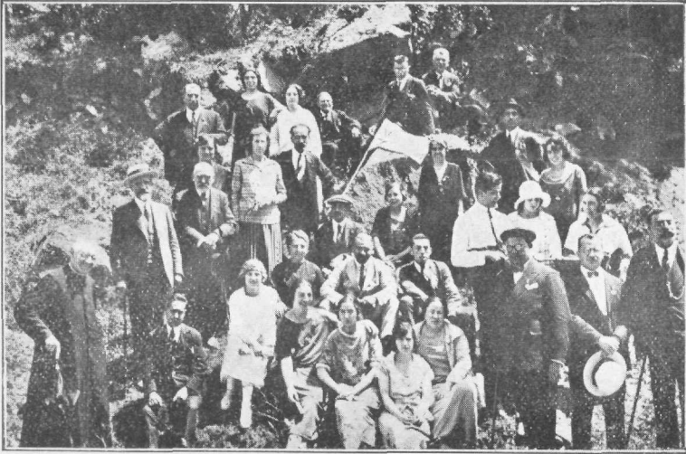
Ekskurso al «Les Guilleries».