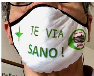
Unua versio de la masko, jam elĉerpita.

La franca Esperanto-kastelo Greziljono produktigis sian propran maskon, lavebla kaj laŭnorma. Eblas mendi ĝin kontraŭ 9 eŭroj, pere de la retadreso kastelo@gresillon.org