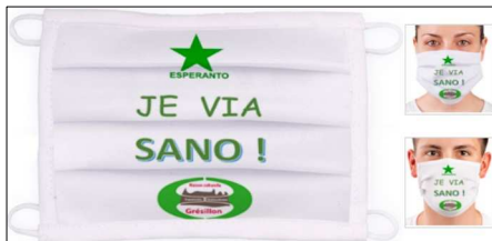
Dua versio de la masko.

Senkoste ricevos ĝin, kiu aliĝos al ĝiaj staĝoj.