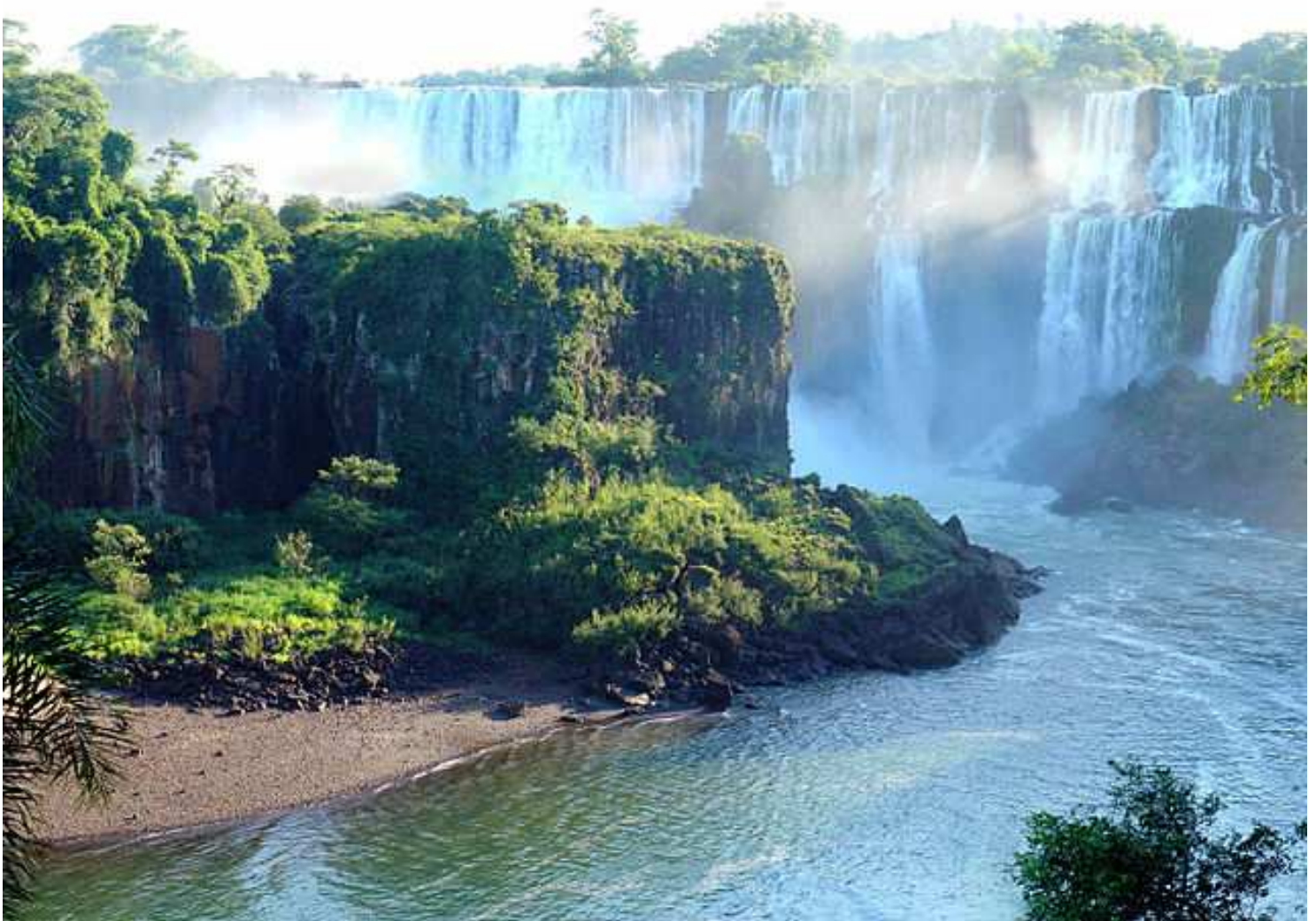
Akvofaloj de Iguazu en Misiones (Argentino)