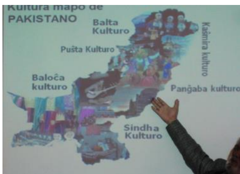
La diversaj kulturoj de Pakistano