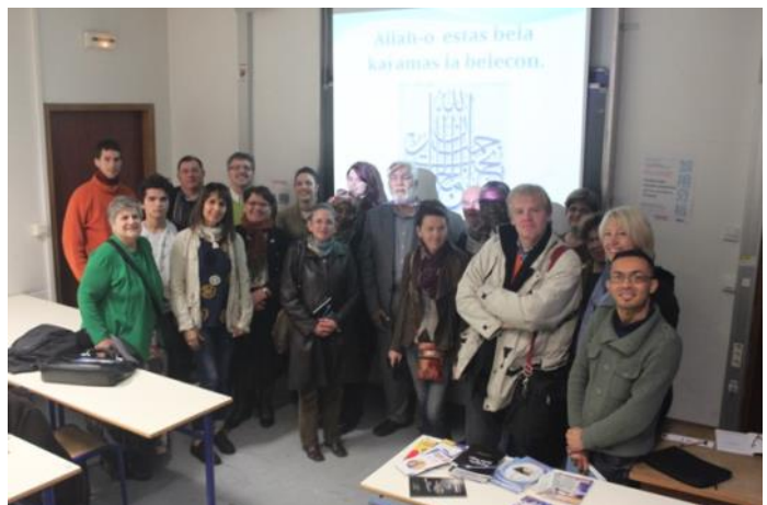
La tuta ĉeestintaro