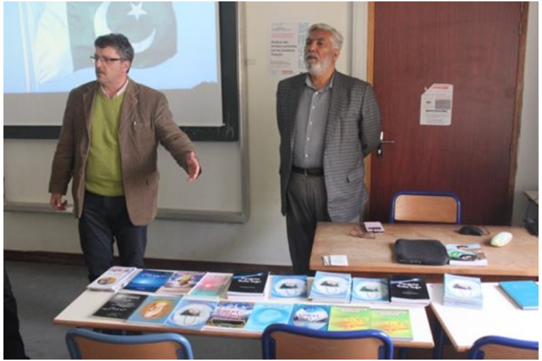
Kelkaj libroj, kiujn verkis Saeed