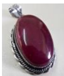
Rubenoj el Baloĉistano