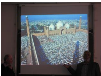
La Reĝa Moskeo en Lahoro

La tre granda moskeo de Lahoro ( Reĝa Moskeo ) el la 17a jarcento povas akcepti 10 000 fidelulojn en la ĉefa ĉambro, kaj pli ol 100 000 en la korto. Sed nun ekzistas tri aliaj pli grandaj, konstruitaj de riĉuloj.