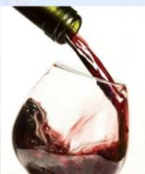
Ne nur sango fluos!

Laborista asocio festas esperanton kaj sian movadon! Kiun peresperantan agadon? Kiel sennaciece aktivi?