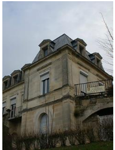
Le Château du Diable, à Cenon

La projekto estos pli precize prezentata post la manĝo.