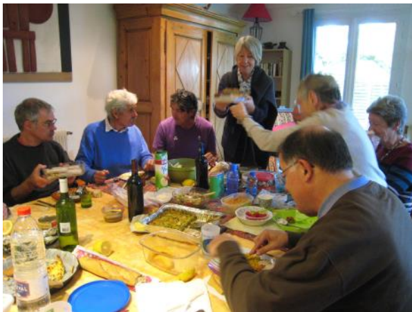
Kiel kutime, grandioza kunmanĝo!