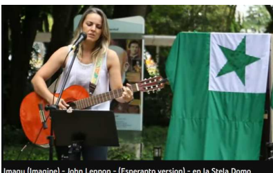
Imagu (Imagine) - John Lennon - (Esperanto version) - en la Stela Domo

https://www.youtube.com/watch?v=81kgO17qCCo&t=1s