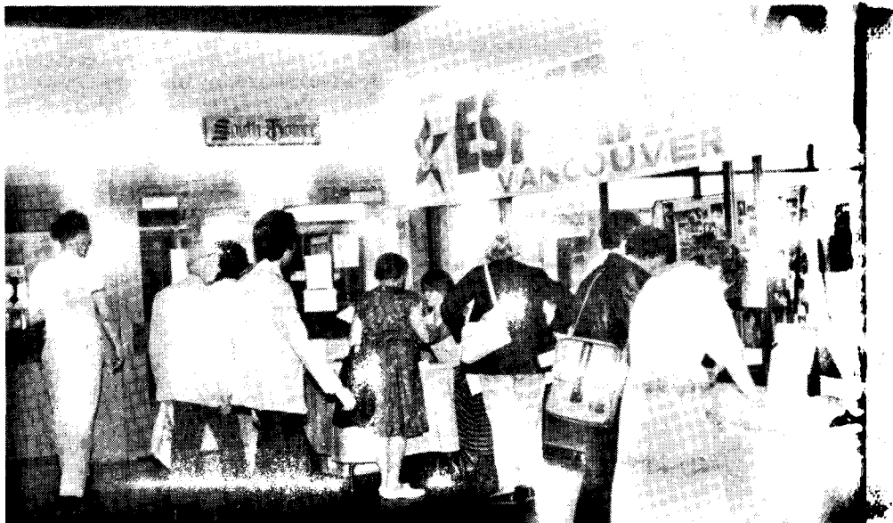
Halo de la vasta kongresejo.