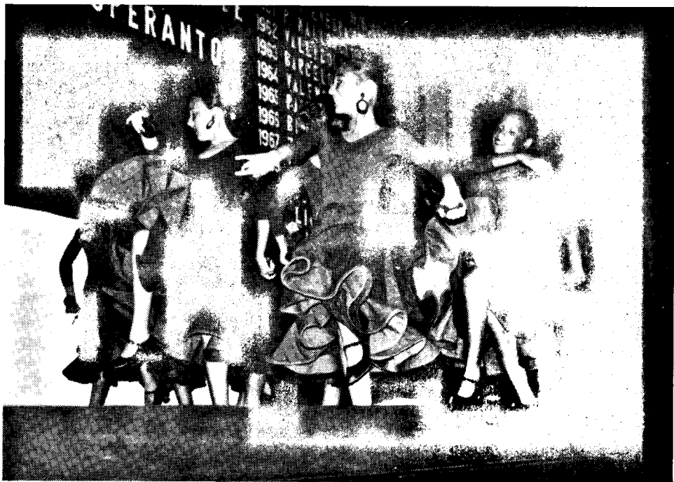
Folkloro prezentado.