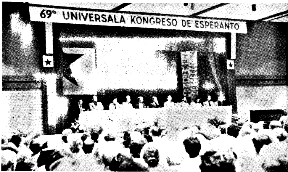
La Solena Inaŭguro (Foto A. Fighiera-Sikorska).