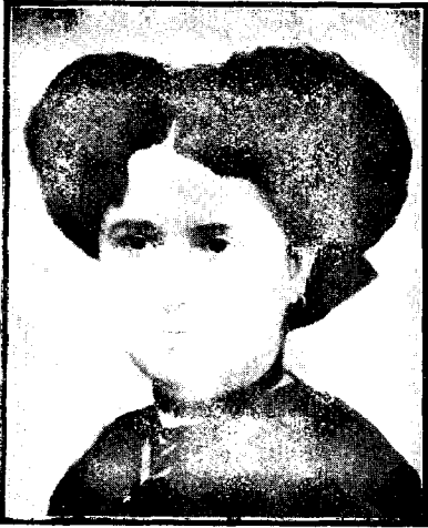
San Torcuato, 30, Zamora (Hispanujo)