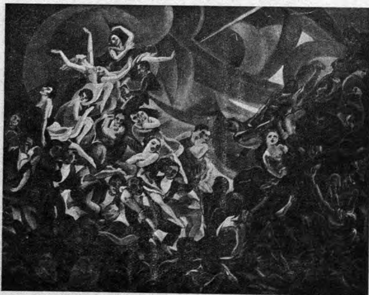
K. Baltgailis: Vivkirlo

Tiam pli alten komprena kompato Portos la koron ĝis Gojo de l' Viv'; »Pacon sur tero al ĉiu homfrato! ... Venis la horo de l' aperitiv'...»