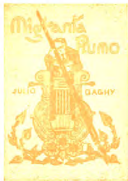
Novelaro 160 pĝ. bind. P 5.— broŝ. P 3.—

C. D. (Catania): Bone ekvilibrata, diŝigenta, ĝentila naturo, kiu sin sentas super la aliaj, kun egoismo, bona observokapablo, sento al realo kaj pasieca parolmaniero.