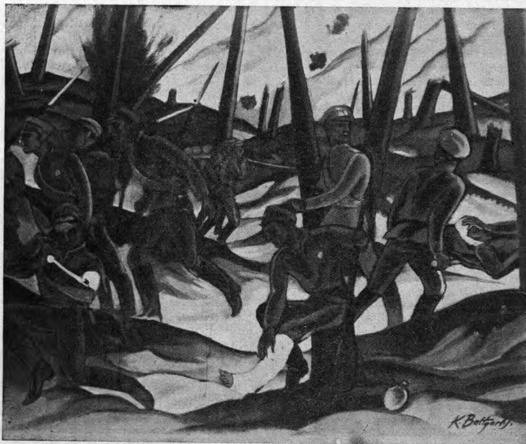
K. Baltgailis : Latvaj militistoj dum la milito

Halinjo sidis sur la benko kaj atente rigardis ĉirkaŭen. Aŭtuna vento pelis amasetojn de falintaj folioj kaj turnadis ilin spirale ĉirkaŭ nevidebla akso. Sur nudaj branĉoj ĝrakis kornikoj, are flugantaj de arbo al arbo. Gajaj infanoj serĉis sur la herbejoj kaŝtanojn por fari el ili longajn kolringojn. La aleon trapasis bela, rozvanga knabeto, per unu mano konduk-