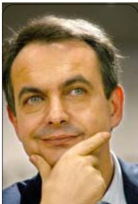
La prezidanto de Hispanio.

ekfuĝis al Parizo pro tio, ke li «estas ĝis la ovoj de ĉiuj ni»; la dua, S-ro Pi i Margaĝ , volis enkonduki federaciismon, kiu preskaŭ disigis la landon en kantonojn; la tria, Nikolao Salmeron , devis uzi perforton por revenigi aferojn en normalecon, sed li rezignis sian pos-