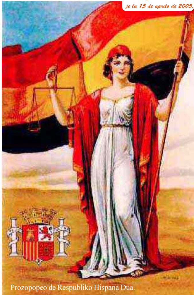
Prozopopeo de Respubliko Hispana Dua.