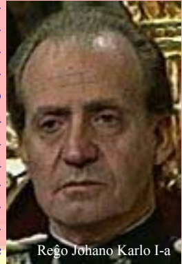
Reĝo Johano Karlo I-a