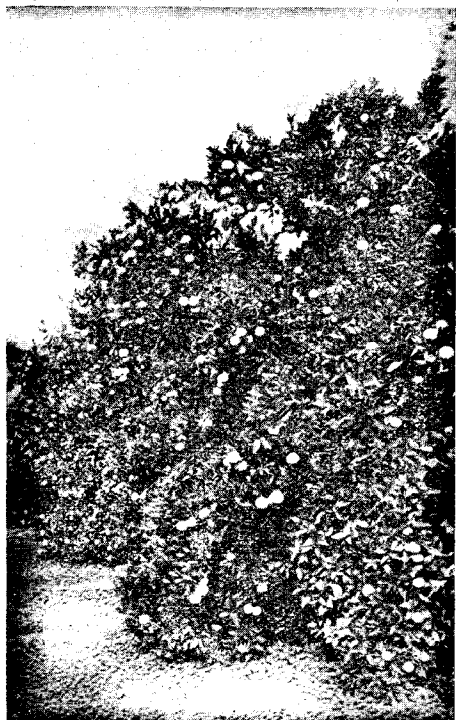
Oranĝarboj dum la rikolta sezono

Ĉe la rikolto, grandega aktiveco vekigas en ĉiuj urboj, urbetoj kaj vilaĝoj de la oranĝokultiva zono. Oni vidas en la ĝardenoj homamasojn kun ŝtuparetoj kaj tondiloj rikolti la fruktojn, kiuj estas tuj transportataj al magazenoj kaj tie mekanike lavataj kaj klasigitaj laŭ grandeco, paperenvolvataj kaj enkestigitaj. Poste oni denove transportas ilin al la havenoj por ilia ensipigo al eksterlando. En la menciitaj magazenoj laboras multaj centoj da miloj da gelaboristoj. Grandaj amasoj svarmas, gajas kaj kantas en la stratoj je la horo de eliro el la magazenoj. Knabinoj