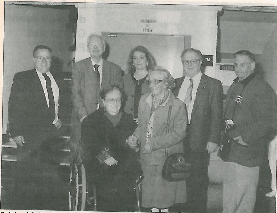
Reinhard Selten, con su esposa y representantes del centro Sol y Mar y del grupo de esperantistas de la región

Tras la visita al Centro Sol y Mar, se desplazó hasta la Academia General del Aire, donde presenció una exhibición aeronáutica, para a continuación proseguir una visita del litoral del Mar Menor. Posteriormente visitó las zonas agrícolas de Pilar de la Horadada y por último viajó hasta Cartagena para conocer la Ciudad Departamental.