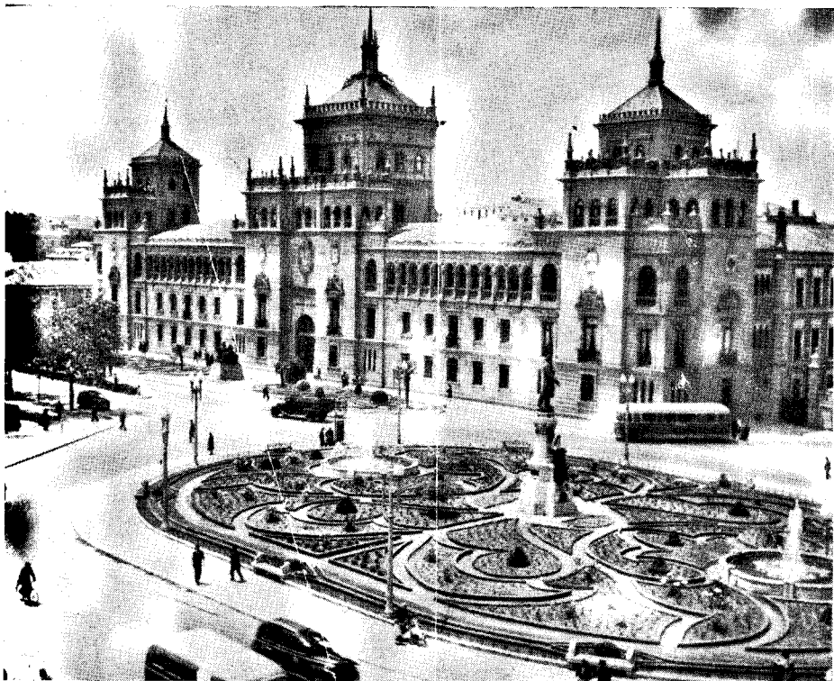
Valladolid.—Plaza de Zorrilla y Academia de Caballería

Valladolid, la bela kaj alloga kastila urbo gastigos la venontan Kongreson de Esperanto. La amasa partoprenanto de la hispana samideanaro estos la pruvo de nia pravo.