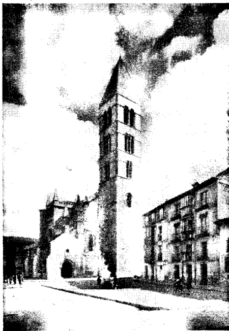
Santa María de la Antigua

bello ejemplar del arte mudéjar; Medina del Campo, con su castillo de la Mota; Medina de Ríoseco, famosa por sus iglesias monumentales y su tesoro artístico; Olmedo, Peñafiel, La Espina, Villagaría, donde pasó su infancia Don Juan de Austria, y tantos lugares más, dignos de la admiración de los turistas.